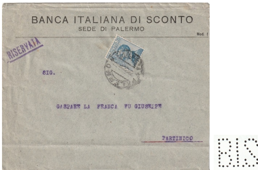
Afb. 1: brief naar Partinico uit 1920 en de perfin B.I.S van het kantoor in Palermo.

De eerste is van het kantoor in Palermo gedateerd 23-2-1920 voorzien van een zegel van 25 centesimi verstuurd naar Partinico. De perfin werd gebruikt van 1914 tot 1932 (zie afbeelding 1).