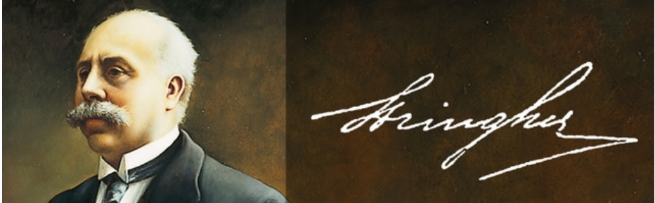
Afb. 4: portret van Bonaldo Stringher met zijn handtekening

Als voorloper van de Banca Italiana de Sconto werd in 1904 de Società Bancaria Italiana opgericht met steun van Bonaldo Stringher (1854-1930), directeur van de Banca Italiana (zie afbeelding 4).