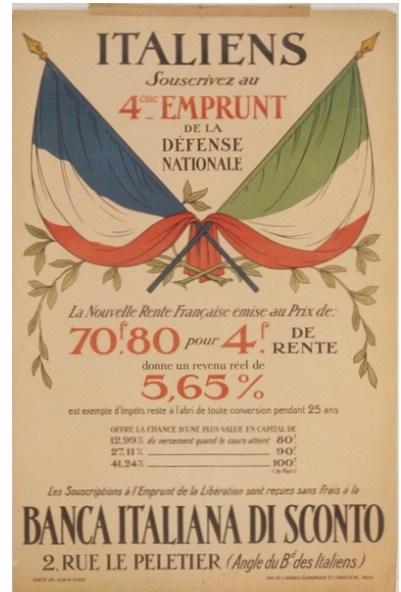
Afb. 8: Oproep om aandelen van de B.I.S. te kopen