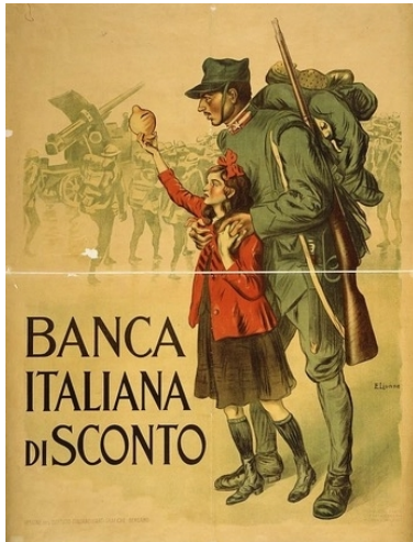
Afb. 6, affiche waarop te zien is dat een meisje haar spaarpot toont aan een soldaat om symbolisch te laten zien dat de bank het leger steunt.