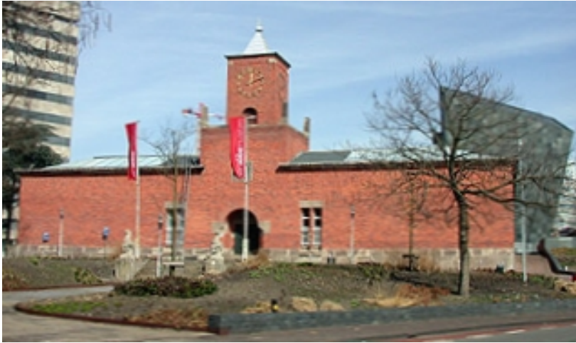
Afb. 5: het Van Abbemuseum in Eindhoven

Daarom richt hij - in navolging van andere ondernemers en kunstverzamelaars - een museum voor schilderkunst op in zijn woonplaats. In 1936 opent het Van Abbemuseum de deuren voor publiek.