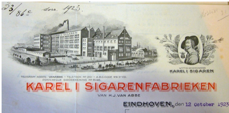
Afb. 3: Brief hoofd van de Karel I-fabrieken uit 1923

In 1929 is de Karel I-fabriek na die van Philips de grootste onderneming in Eindhoven en heeft dan 1.345 werknemers.