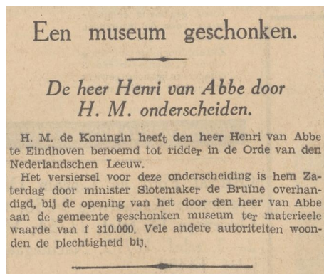
Afb. 6: artikel uit de Utrechtse Courant, april 1936