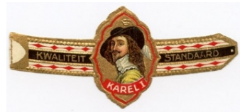
Afb. 7 en 8: sigaren doosje en sigarenbandje Karel I