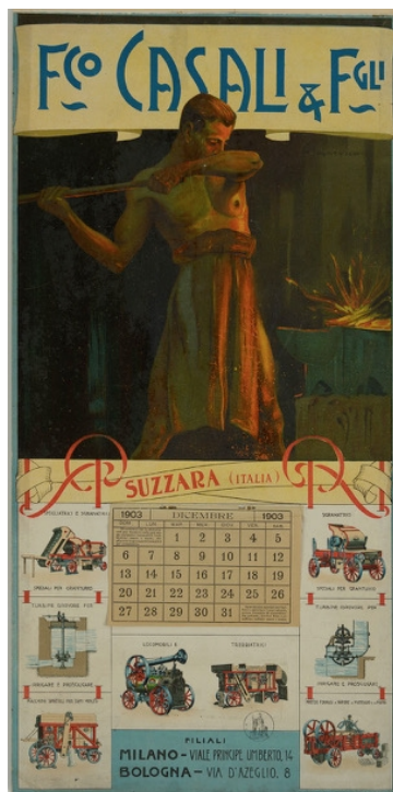
Afb. 5: Kalender van Casali uit 1903

In 1909 kwam de dopmachine onder de naam 'Vittoria' op de wereldmarkt, later gevolgd door de 'Universal Victory' dorsmachine.