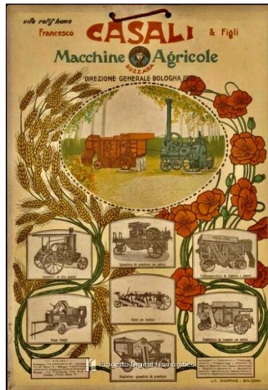
Afb. 7: reclamekaart van Casali

Het hoofdkantoor verhuisde in 1919 naar Bologna vanwege het vakbondsklimaat en een conflict met de kamer van koophandel te Suzzara. In 1922 kwam de CIMAC in een liquidatiefase en stopte haar activiteiten in juni 1922. De bedrijfspanden werden overgenomen door de MAIS (Meccanica Agricola Industriale Suzzarese), geholpen door vier oud medewerkers van Casali.