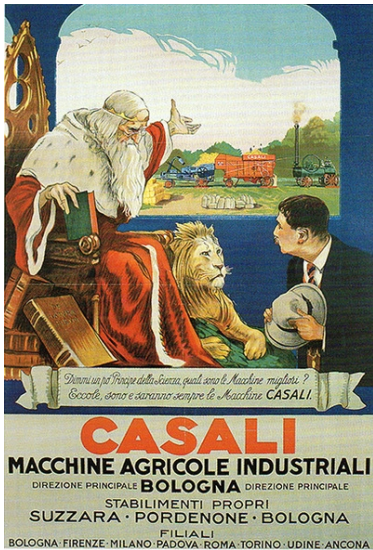
Afb. 6: affiche van Casali

In 1912 werd door Casali de landbouwmechanisatie voortgezet, maar de eerste Wereldoorlog veroorzaakte een sterke daling van de verkopen. Het bedrijf werd hierdoor genoodzaakt om zich ook toe te leggen op de productie van wapens. Doordat de mannen naar het front waren werden de banen nu bezet door de vrouwen. In 1918 was het door deze omschakeling voor veel fabrieken aanleiding om te fuseren met andere bedrijven. Casali ging in zee met de CIMAC (Compagnia Industriale Macchine Agricole Casali) die twee fabrieken had een in Suzzara en een in Mantua.