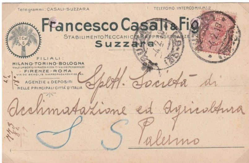
Afb. 2: Kaart met de perfin F.C./F. uit februari 1919

De kaart werd verstuurd op 4-2-1919 vanaf Suzzara voorzien van een tien centesimi postzegel wat een voldoende frankering was voor de reis naar Palermo (zie afb. 2).