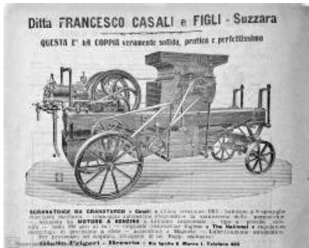
Afb 4: agrarische machine van F.C.F.

Vanaf 1885 ging Casali zich niet alleen bezig houden met reparaties van landbouwmachines maar begon ook met het ontwerpen en bouwen van nieuwe modellen, zoals een egneringmachine genaamd de 'Invincebile' (voor het scheiden van katoenvzels van de zaden). Zie afb. 4.