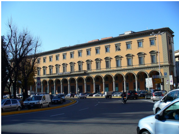
Afb. 9: Het kantoor van La Fondiaria in Piazza della Libertà in Florence.

In 1938 dwongen de rassenwetten veel leidinggevenden tot aftreden, zoals in veel bedrijven in Italië gebeurde.