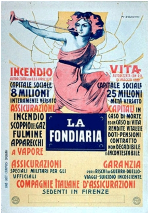
Afb. 8: verzekeringszegel

In 1903 werd het bedrijf genoteerd aan de beurs van Milaan. In 1912 werden tijdens de regering van Giolitti de levensverzekeringen genationaliseerd. Hierdoor werd 'La Fondiaria' gedwongen om zijn levenstak over te dragen aan de INA, eigendom van de staat.