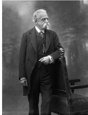
Afb. 5: Prins Corsini

Het bedrijf hanteerde een destijds innovatief organisatiemodel, wat wil zeggen dat het was opgedeeld in verschillende bedrijfsonderdelen, die wel tot hetzelfde vastgoed behoorden, maar ieder een eigen gespecialiseerde bedrijfstak waren.