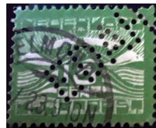
Afb. 10: perfin EDAH in twee luchtpostzegels 1)

Vanaf 1922 ontbreekt de punt achter de H (H12). Tot nu toe heb ik in mijn verzameling de NVPH zegels 54-55-57-60 en 61 met de punt achter de H. Graag hoor ik of er nog meer zegels bekend zijn met deze punt achter de H.