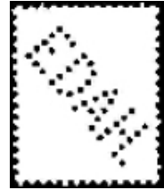
Afb. 3: perfin EDAH

De perfin EDAH is in gebruik geweest van 1918 tot en met 1947. Daarna zijn ze overstapt naar het gebruik van een roodfrankeermachine (zie afb. 4).