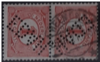
Afb. 11: EDAH diagonaal in de zegels 1)

Waarschijnlijk heeft een jongste bediende die belast was met het perforeren van de zegels zich een beetje laten gaan.