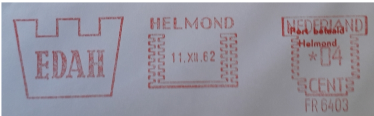
Afb. 4: roodfrankering door EDAH in december 1962 1)