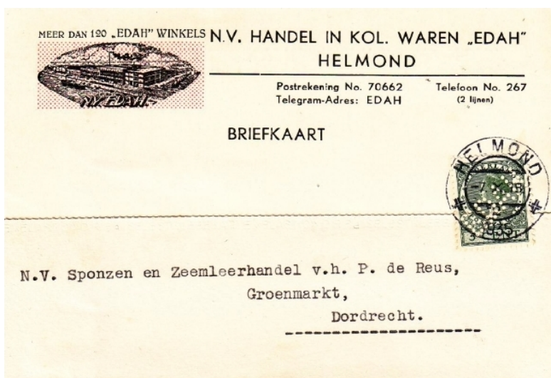
Afb.8: Briefkaart uit okt. 1935 waarop meer dan 120 winkels staan aangegeven 1)

Al die winkels moesten natuurlijk wel bevoorrad worden. En dat gebeurde in de jaren dertig van de vorige eeuw met eigen vrachtwagens (zie afbeelding 9).