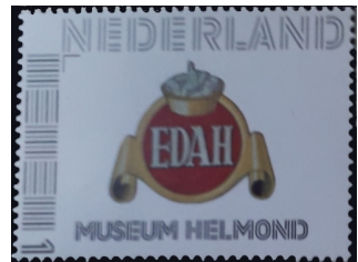
Afb. 6: zegel van het EDAH-museum 1)

In en bij het museum is ook een grote collectie accordeons en draaiorgels te bewonderen. Het museum heeft in 2011 ook een eigen zegel uitgegeven (zie afbeelding 6)