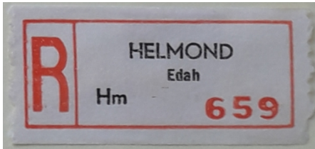
Afb. 5: eigen aantekenstrookje van EDAH 1)

Natuurlijk was er ook post die aangetekend verstuurd moest worden. Om dit in de postkamer sneller te kunnen doen heeft de EDAH ook haar eigen aantekenstrookjes gehad, zodat deze post direct op het postkantoor bij het juiste loket kon worden afgegeven (zie afbeelding 5).