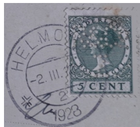
Afb. 1: perfins CCB, K, S&ZR en R&CoZ met afstempeling Helmond 1)

Graag hou ik me aanbevolen voor andere perfins die zijn afgestempeld in Helmond, of meldingen daarvan.