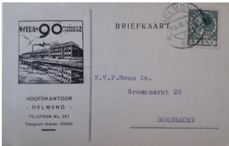
Afb. 7: Briefkaart van feb. 1928 waarop 90 EDAH-winkels staan aangegeven 1)