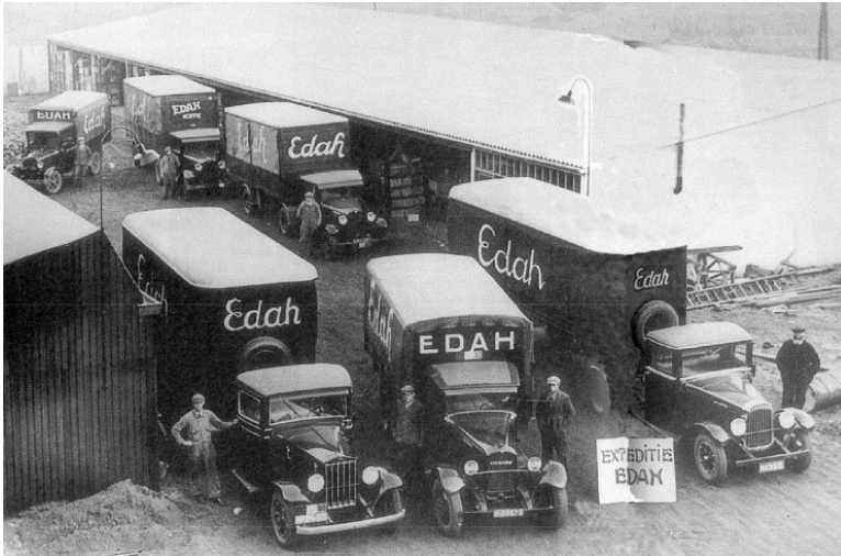
Afb. 9: het wagenpark van EDAH in de jaren dertig 2)

De perfin EDAH is tot nu toe bekend op 86 verschillende zegels waaronder twee luchtpostzegels (zie afbeelding 10).