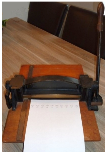
Afb. 3: de NBA 2--perforator

PNEM 2: van deze perfin zijn publicaties waarin de machine getoond wordt, daarom ga ik er van uit dat deze machine ook nog bestaat (zie afbeelding 4).