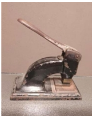
Afb. 1: de M&Co 3-perforator