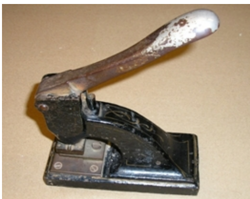
Afb. 2: de NBV Tiel-perforator

Van enkele machines is ons bekend dat ze voorkomen in archieven. Deze machines bestaan dus nog maar zijn daar (relatief) 'veilig'. Dat zijn NB , T 2 en NBV Apeldoorn .