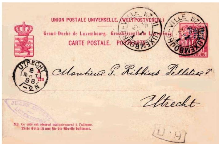
Afb. 1: Briefkaart met de oudst bekende perfin van Luxemburg

Er zijn maar twee briefkaarten van Luxemburg bekend met een perfin door de briefkaart zelf. De hieronder afgebeelde briefkaart bevat zelfs de oudst bekende perfin van Luxemburg. De kaart is namelijk verzonden op 1 maart 1888 terwijl in Luxemburg pas in 1907 officieel toestemming gegeven is voor het perforeren van zegels. Ook zegels met de perfins S.D. en W.L. zijn bekend van voor deze datum, respectievelijk van 1891 en 1892.