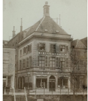
Afb. 6: het grachtenpand in Utrecht van de fa. Peletier Afb. 7: pand De Grote Steen

De fabriek lag verscholen achter een statig grachtenpand. De statige gevel van het pand was voorzien van boogramen en boven aan de voorgevel stonden twee leeuwen met een schild (zie afbeelding 6). Dezelfde versiering was ook aangebracht op de loopbrug boven de Eligensteeg die de fabrieksgebouwen aan weerszijden met elkaar verbond. Van oudsher droeg het pand de naam 'De Gesloten Steen', die zijn oorsprong vond in een kei aan een ketting ter hoogte van de ingang van de steeg naast het gebouw. De eigen winkel, afbeelding 7, was ook in hetzelfde pand te vinden. De fabriek is in 1933 failliet gegaan.