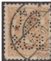
Afb. 5: JS&Co-perfin