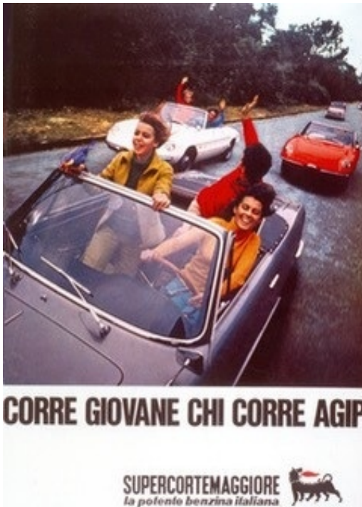
Afb. 5: Advertentie van AGIP

De zes poten van de hond moesten de bovennatuurlijke kracht uitdrukken van de A.G.I.P.-benzine. Hij had zich waarschijnlijk laten inspireren door de Griekse en Afrikaanse mythologie waar de dieren ook vaak zo werden afgebeeld.