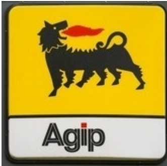
Afb. 3: AGIP-logo

Alle aandelen waren in handen van de overheid en daaraan gelieerde bedrijven. AGIP kreeg als kerntaak het zoeken naar en het in productie nemen van olie en gas. Helaas was er in Italië hiervan weinig te vinden. Wegens gebrek aan succes besloot de regering na de 2 e wereldoorlog het bedrijf te sluiten en hiervoor werd Enrico Mattei aangesteld.