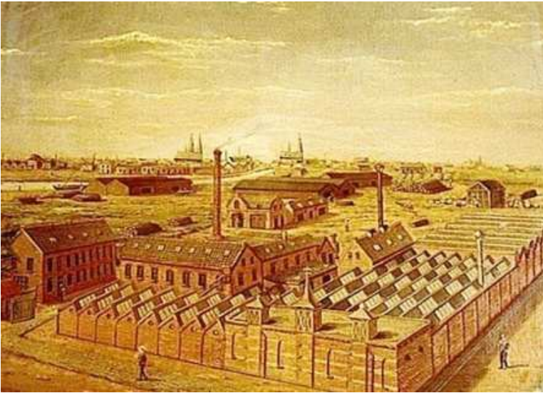
Afb. 3: Tongelresestraat olieverfschilderij van complex van de sigarenkistenfabriek J. Bruning & Zoon, gemaakt door F. Das, 1898. 3)

De firma Brüning gebruikte de perfin JB&Z 1 in de periode 1907-1912.