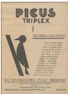
Afb. 6: logo van Picus 6)

In 1912 werd het bedrijf omgezet in een N.V. en ging N.V. Houtindustrie Picus heten, naar de wetenschappelijke naam voor de specht, die ook op het logo verscheen (zie ook afbeelding 6).