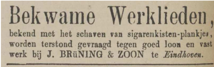
Afb. 1: personeelsadvertentie uit december 1884 2)

In 1883 werd aan de Tongelresestraat in Stratum (tegenwoordig een wijk van Eindhoven) startte een bedrijf onder de naam J. Brüning & Zoon. Oprichter was Johann Brüning, afkomstig uit het Duitse Langendiebach. Het bedrijf stond bekend als een 'door stoom te drijven sigarenkistenfabriek'. 1)