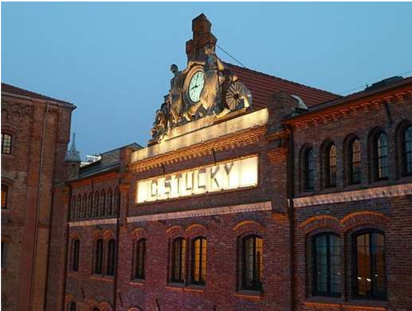
Afb. 4: voorgevel van de fabriek van G. Stucky

Dit had groot succes gezien het aantal van 1500 arbeiders die wel 250 ton meel per dag produceerden. In Portogruaro kocht Stucky 1700 hectare akkergrond om daar tarwe op te verbouwen. In 1900 bezat Molino Stucky de grootste elektrische verlichting van Venetië.