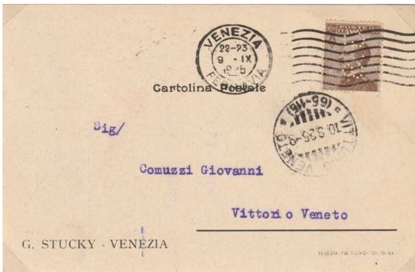
Afb. 2: briefkaart uit 1925 met de perfin G.S

Onderstaande briefkaart (afbeelding 2) is afgestempeld op 9 september 1925 met het Stationstempel voorzien van een postzegel van 40 centesimi wat voldoende frankering was voor een binnenlandse briefkaart. Het aankomststempel Vittorio Veneto (65-115) is een treinstempel.