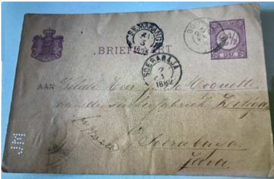
Afb. 1: Nederlandse briefkaart afgestempeld in 1882 met JM erin geperforeerd

Pas geleden kreeg ik onderstaande scan (zie afbeelding 1) toegestuurd met de vraag wat ik hier van vond.