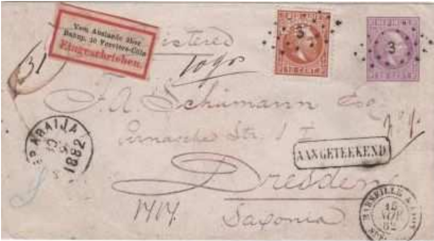
Afb. 2: Brief met de perfin JM in zegel van Nederlands Indië