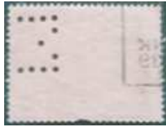
De perfin E (of M)

E deze perfin lijkt mij wel echt. Toch durf ik deze echter niet op te nemen omdat hij wel erg dicht tegen de rand is geperforeerd. De kans dat hij onvolledig is lijkt mij groot. Het is overigens ook onduidelijk of het een M of een E is.