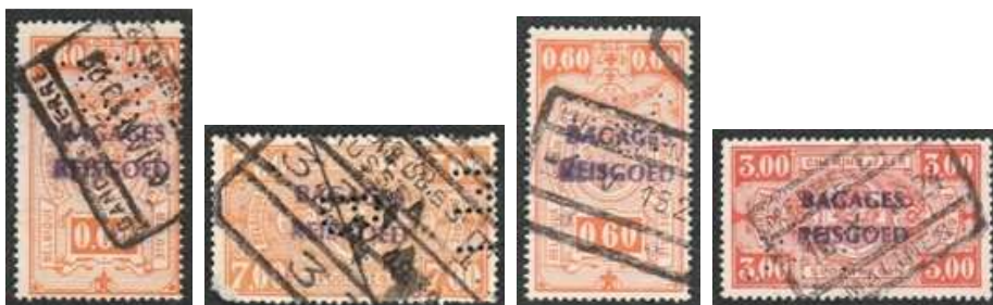
CR.7 zegel n°6 MIB zegel n° 16

Daarnaast is er een extra categorie naar voren gekomen. Er zijn 3 meldingen gedaan van perfins in 'Bagage Reisgoed zegels', dat is ook een soort fiscaalzegel.