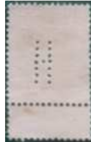
De valse perfin H