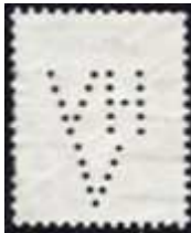
Afb. 6: poko HVV in Nederlands zegel

Ik ben er zeker van dat deze poko vanuit dezelfde pokomachine komt.