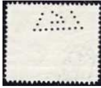
Afb. 5: driehoek met 2 in zegel nr. 164

De perforatie lijkt mij echt. Helaas zien we niet de gehele perforatie.