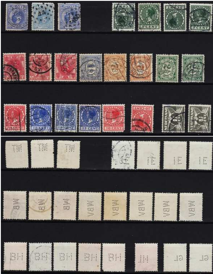
Afb. 1: Stockkaartje met 'nieuwe' perfins

Tijdens de jubileumbijeenkomst van 5 maart hebben meerdere mensen mij mogelijk nieuwe perfins voorgelegd met de vraag of ik daar mijn mening over zou willen geven. Als eerste twee stockkaartjes met allemaal “nieuwe” perfins, zelfs in aantallen (zie afbeelding 1).