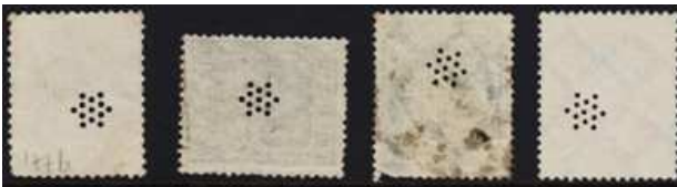
Afb. 3: Duitse perfin met ster