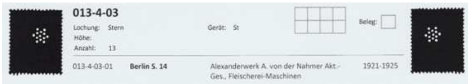
Afb. 4: kopie uit Duitse perfincatalogus

Een ander lid melde een aantal nieuwe zegels aan maar liet mij ook twee perfins in Nederlandse zegels zien die wel erg bijzonder zijn.