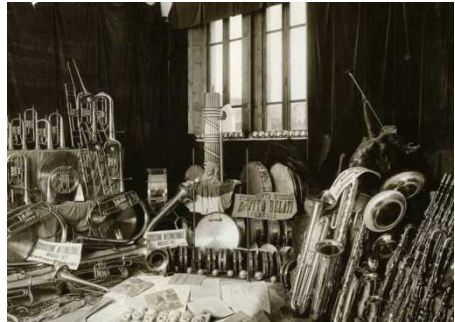
Afb. 7: de muziekinstrumenten van Belati

In 1930 brak door de wereldcrisis voor het Perugiaanse bedrijf een zware tijd aan. De productie van muziekinstrumenten moest gestopt worden. De band activiteiten waren sterk achteruitgelopen door de recessie en de eerste wereldoorlog, wat gekenmerkt werd door de instorting van de Afro-Amerikaanse muziek.