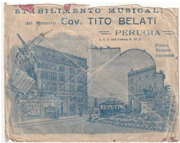
Afb. 3: de achterzijde van de brief met afbeelding van de winkel.

Op de achterzijde van de brief is de winkel van Belati afgebeeld.