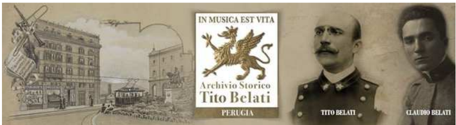
Afb. 4: de winkel van Belati aan het Piazza Vittorio Emanuele met daarnaast de portretten van Tito en zoon Claudio Belati.

In juni 1905 verhuisde de familie naar Perugia, het bedrijfje zat daar ook nog steeds op een appartement. De verkoop van bladmuziek liep zo goed dat hij zijn militaire loopbaan op gaf om zich volledig te wijden aan zijn uitgeverij van bladmuziek. Het bedrijf vestigde zich in een pand aan het Piazza Vittorio Emanuele (nu Piazza Italy). In 1909 werd in een aangrenzend pand gestart met de bouw van muziekinstrumenten met de nadruk op blaasinstrumenten.