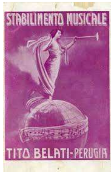
Afb. 5: de bedrijfskrant van Belati

Hierin werden behalve reclame voor het bedrijf ook compositiewedstrijden georganiseerd voor bands. De winnaars van de composities werden in de catalogus van het bedrijf opgenomen.