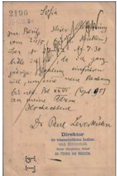
Afb. 3 Achterkant van de kaart