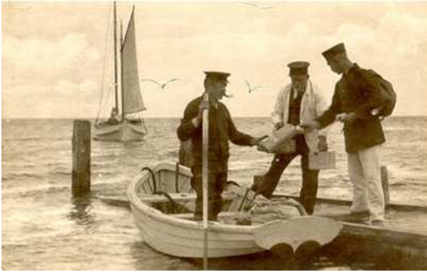
Afb. 8: overhandiging van de post voor de halligen. Briefkaart omstreeks 1900