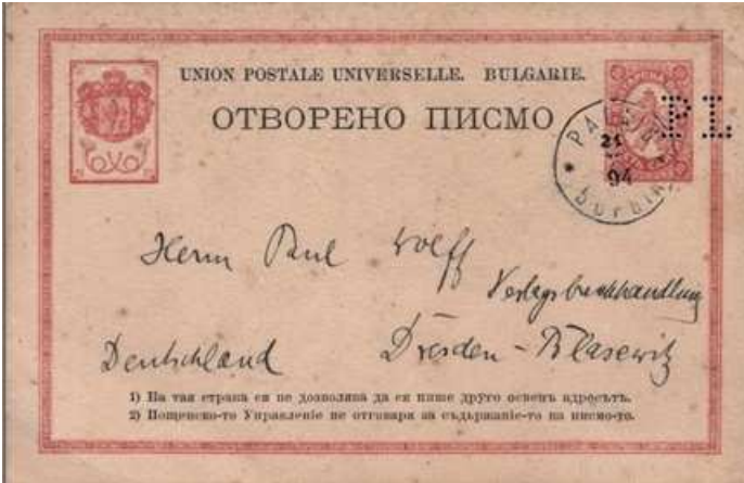
Afb. 2: de voorkant van kaart (Bulphila P 1) met PL perforatie

De kaart met PL-perforatie (zie afb. 2) zal voor de verzamelaars van Bulgaarse perfins voldoende bekend zijn (Popov 2009: 15, Penkov 2011: 33) – afkomstig uit de collecties ex- Barbara Klos USA en ex - Dick Scheper.