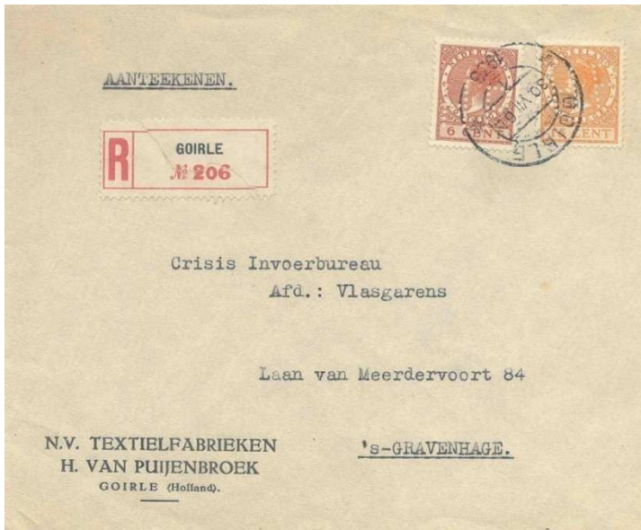
Afb. 7: brief van de NV Textiel Fabrieken H. van Puijenbroek , 30 juli 1936 5)

De economische crisis van de jaren 30 leidde ook hier tot grote moeilijkheden. In 1932 kwam zowat de helft van het personeel op straat te staan. Een jaar later werd al weer vernieuwd: men ging wollen modekleding maken en vanaf 1935 ook de confectie van bedrijfskleding. Oprichter Harrie (Hendrikus) van Puijenbroek overleed in september 1936.