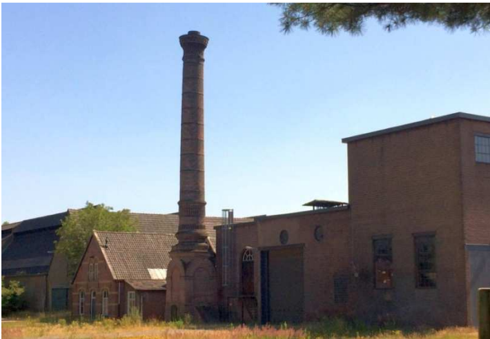
Afb. 8: het oude fabriekscaplex aan de Bergstraat in mei 2020. Het machinehuis met een stoommachine van Werkspoor is inmiddels een rijksmonument 6)

In 1992 gaat het bedrijf samen met de Budelse Confectie Fabriek (Bucofa), waarmee samenwerking start met wasserijen en de auto-industrie. Men gaat samen verder onder de naam HAVEP.