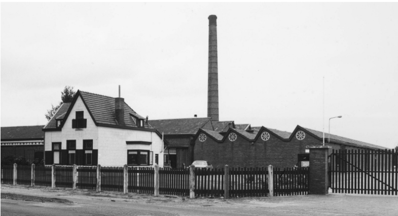
Afb. 4: de weverij in Tilburg aan de Oude Goirleseweg in 1920 2)

Maar de directie zette door, kocht een stuk grond aan de Oude Goirleseweg 150-152 in Tilburg, waar een nieuwe machinale weverij werd gebouwd. In 1911 verhuisde de weverij naar Tilburg. Het hoofdkantoor van het bedrijf bleef aan de Bergstraat 50 in Goirle.