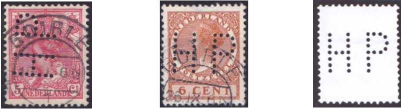
Afb. 5: De perfin HP 2 4)

Gedurende een lange periode, van 1907 tot 1953, gebruikte Van Puijenbroek de perfin HP 2 (zie afbeelding 5).