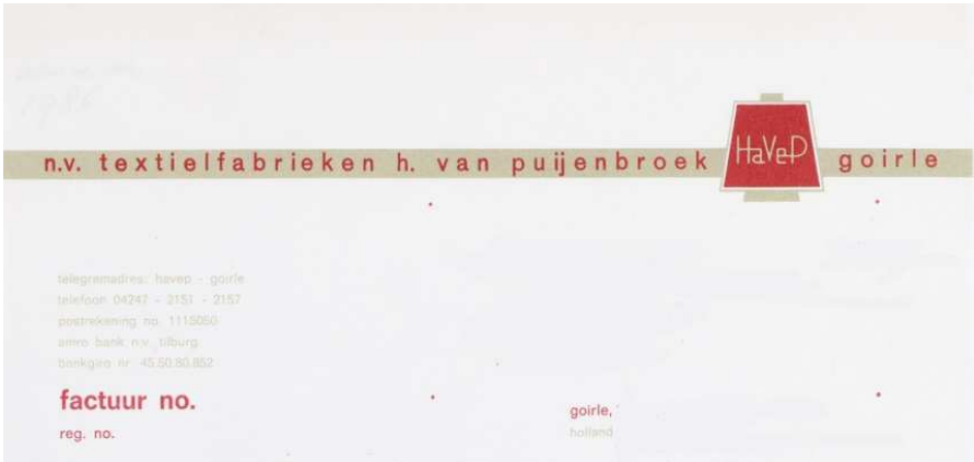
Afb. 8: Briefhoofd van HaVeP op een factuur van 1972 2)

In 1992 gaat het bedrijf samen met de Budelse Confectie Fabriek (Bucofa), waarmee samenwerking start met wasserijen en de auto-industrie. Men gaat samen verder onder de naam HAVEP.