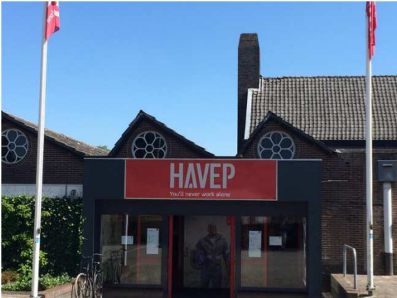
Afb. 9: HAVEP had in 2020 nog een winkel (die dit jaar werd gesloten) bij de oude fabriek aan de Bergstraat in Goirle en gaat binnenkort verhuizen binnen Goirle 6)

Toen in 2015 het bedrijf 150 jaar oud was, kreeg HAVEP het predikaat 'Hofleverancier' en mocht het zich de Koninklijke Textiefabriek Van Puijenbroek noemen.