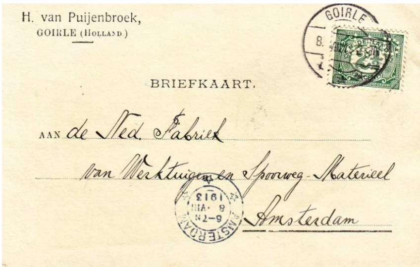
Afb. 6: briefkaart van H. van Puijenbroek, gedateerd 8 augustus 1913 5)

In de Catalogus van de Perfins van Nederland staat alleen het adres Goirlesche weg 20 genoemd. Dat komt niet overeen met de adressen van de twee locaties waar de firma in feite gevestigd was: de Bergstraat 50 in Goirle (wat nog steeds in gebruik is) en de Oude Goirlescheweg 150-152 in Tilburg. Deze adressen staan overigens niet vermeld op de poststukken van het bedrijf die mij bekend zijn (zie de afbeeldingen 6 en 7). Ook op het briefpapier (bijv. facturen e.d., zie afb. 8) werd het adres niet vermeld.