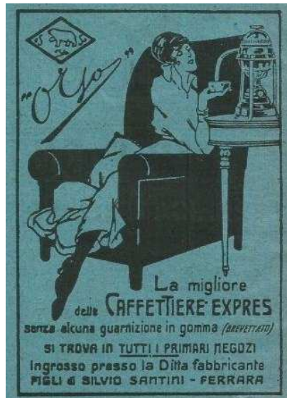
Afb. 6: reclameposter van Fratelli Santini