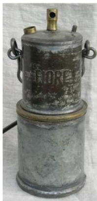
Afb 2: twee oude olielampen van Fratelli Santini