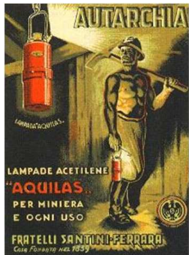
Afb. 4: reclame voor Aquilas-verlichting

Het assortiment producten vervaardigd onder de bekende merken 'Aquilas' (octrooinr. 5.967), zie afbeelding 4 en 'Santini' (octrooinr. 33674) omvatte ook echt artistieke items, zoals de in brons gemonteerde lampen van nationaal keramiek