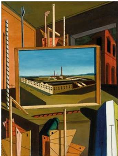
Afb. 7: fabriek op schilderij van Giorgio de Chirico

De bekende fabriek van verlichting, huishoudelijke artikelen en snuisterijen van de gebroeders Santini is vertegenwoordigd in een van de beroemdste werken die Giorgio de Chirico schildert tijdens zijn verblijf in Ferrara. Het bestaat overigens helaas niet meer.