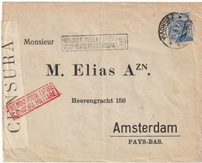
Afb. 5: brief met FS-perfin, verstuurd in 1916