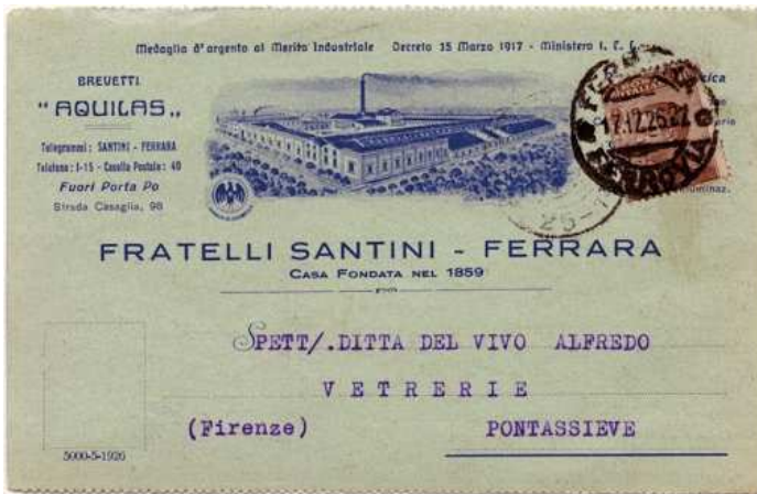
Afb. 3: briefkaart met afbeelding van de fabriek in Ferrara

In 1900 werd een nieuwe grotere en moderne fabriek gebouwd (zie afbeelding op briefkaart, afb. 3).