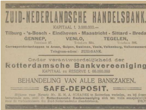
Afb 2: Advertentie van de Zuid-Nederlandsche Handelsbank in oktober 1919 2)

In 1923 werd de bank verbouwd en uitgebreid, waarna de naam veranderde in Nationale Bank Vereeniging (NBV) Tilburg. (zie artikel NTC 7-12-1923)