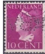
Afb. 7: de perfin RBV Tilburg 4)

Veel van de bovenste rijen gaatjes van deze perfin vielen in de loop van de tijd weg (zie afbeelding 8). Na 1952 zie je toch ook weer volledige perfinns.