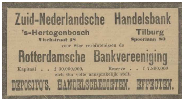
Afb. 1: Advertentie van de Zuid-Nederlandsche Handelsbank in okt. 1914 2)

Vóór 1922 was er in Tilburg een vestiging van de Robaver, die opereerde onder de naam Zuid-Nederlandse Handelsbank of Zuidbank. (zie advertenties uit 1914 en 1919)