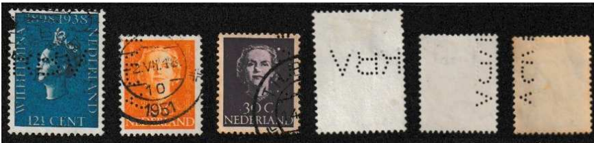
Afb. 8: voorbeelden van het wegvallen van rijen gaatjes. 4)

Veel van de bovenste rijen gaatjes van deze perfin vielen in de loop van de tijd weg (zie afbeelding 8). Na 1952 zie je toch ook weer volledige perfinns.