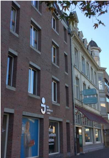
Afb. 10: pand aan de Spoorlaan, waarin nu het Juridisch Loket is gehuisvest 6)

Waar vroeger het bankgebouw van NBV en RBV Tilburg stond, staat nu een ander pand, waarin tegenwoordig het Juridisch Loket is ondergebracht.