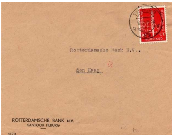
Afb. 9: poststuk met RBV-perfin gedateerd 17-05-1955. 'Rotterdamsche Bankvereniging' was inmiddels 'Rotterdamsche Bank NV' geworden. 5)