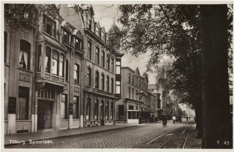
Afb. 5: het gebouw van de NBV en later RBV aan de Spoorlaan in 1934 3)

Het kantoor van de NBV Tilburg en later ook de RBV Tilburg was gevestigd aan de Spoorlaan 80, later omgenummerd naar 110 (zie afbeelding 5, een foto van het oude gebouw, dat helaas niet meer bestaat).