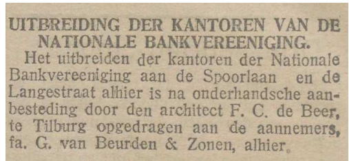
Afb. 3: Artikeltje over uitbreiding van het bankgebouw in de Nieuwe Tilburgsche Courant, 26-12-1923 2)

In 1923 werd de bank verbouwd en uitgebreid, waarna de naam veranderde in Nationale Bank Vereeniging (NBV) Tilburg. (zie artikel NTC 7-12-1923)