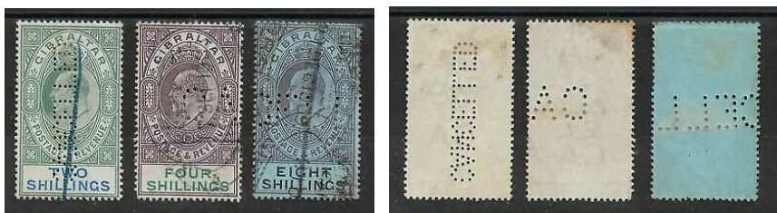
Afb. 5: perforatie CANCELLED links in kleine letters, rechts 2 keer in grote letters.

Volgens het artikel in het Perfins Bulletin 1) zijn er ook nog andere perfins. Twee versies van CANCELLED en daarnaast de SPECIMEN-perforatie die te vinden is in zegels uit veel Britse kolonies. Hoewel ze perfins worden genoemd, zijn het geen echte perfins. De perforatie CANCELLED is immers pas achteraf door zegels en papier heen aangebracht. En bij SPECIMEN gaat het niet om een firmaperforatie.