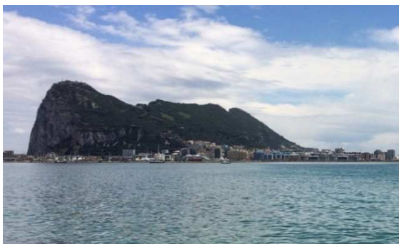
Afb. 1: de bekende Rots van Gibraltar 2) .

In The Perfins Bulletin van maart/april 2020 is een artikel gewijd aan de perfins van Gibraltar 1) . Gibraltar is een klein Brits overzees gebiedsdeel met van zo'n 6,8 km 2 dat in het noorden grenst aan het Spaans vasteland. De landtong wordt gekenmerkt door een grote rots met aan de voet daarvan een dichtbevolkt stadje met zo'n 32.000 inwoners.