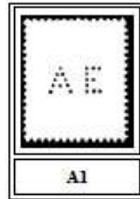
Afb. 2: de perfin AE van Gibraltar

De gebruiker staat niet genoemd in de catalogus, omdat er geen enkel poststuk bekend is waarop die perfin aangebracht is. Volgens het eerder genoemde artikel is er genoeg bewijs dat de gebruiker de Anglo-Egyptian Bank Ltd is 1) .