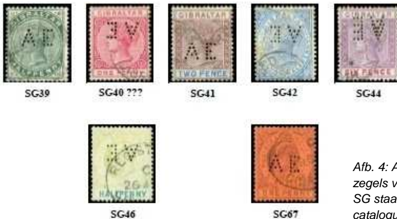
Afb. 4: AE in diverse zegels van Gibraltar. SG staat voor de catalogus van Stanley Gibbons

De perfin AE is in diverse zegels van Gibraltar terug te vinden 5) .