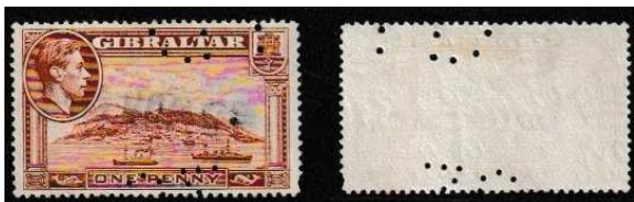
Afb.7: een onbekende perforatie in een zegel van Gibraltar van 1938 of later 6) .

In mijn collectie vond ik een onbekende perforatie in een zegel van Gibraltar van na 1938 (zie afbeelding 7).