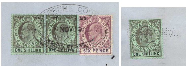
Afb. 6: brieffragmenten met de perforatie CANCELLED 6)