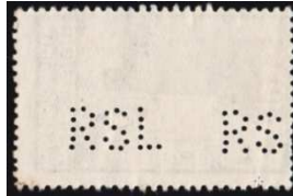
Afb. 7: twee zegels die meerdere versies van de perfin laten zien 6)

Er zijn helaas weinig poststukken bekend van de Red Star Line. De firma gebruikte enveloppen met op de achterkant de vlag en naam in rood met wit gedrukt (zie afbeelding 8).