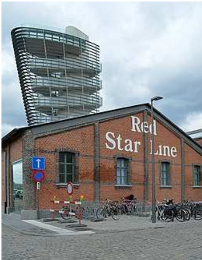
Afb. 9: het Red Star Line Museum aan de Rijnkade in Antwerpen 3)

Het Red Star Line Museum is een museum in Antwerpen over de geschiedenis van de Red Star Line, dat op 28 september 2013 werd geopend.