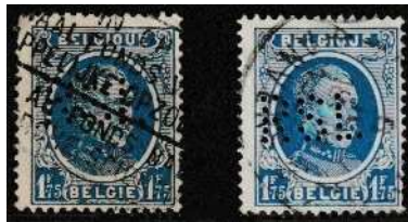
Afb. 6: twee versies van de perfin RSL 5)