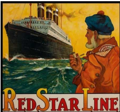
Afb.3: Affiche van de Red Star Line 4)

Reizigers van de derde klasse moesten eerst hun bagage laten desinfecteren en naar de dokter voor een controle. Die controle gebeurde in het begin in open lucht; pas na vele klachten bouwde de Red Star Line een extra gebouw.