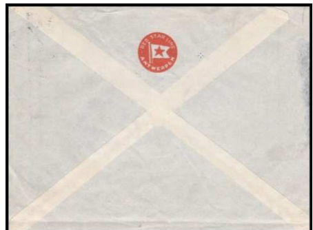
Afb. 8: poststuk met RSL-perfin uit 1920 met op de achterkant vlag en naam van de Red Star Line gedrukt. 6)