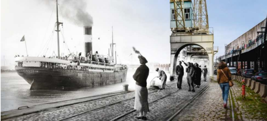
Afb. 2: schip van de Red Start Line vertrekt vanaf de Rijnkaai in Antwerpen 3)

SANBA was gevestigd op de Jordaenskaai en later op de Rijnkaai. De schepen legden altijd aan de Rijnkaai aan. Hier kwamen de passagiers bij elkaar om aan boord te gaan van een van de 23 Red-Star-Lineschepen. De bekendste daarvan zijn de Belgenland, de Friesland, de Vaderland en de Westernland. Daarnaast maakte het gebruik van 150 schepen die werden gecharterd. Die schepen vertrokken vanaf de Rijnkaai in Antwerpen (zie afbeelding 2).