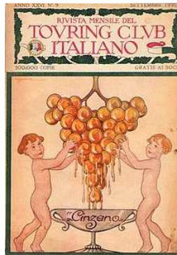
Afb. 4: de Italiaanse Toeringclub

In 1910 werd het merk OLEOBLITZ geïntroduceerd voor de automobielsector. Eerst voor de FIV Eduardo Bianchi motoren en later voor de Isotta Fraschini auto's (zie afbeelding 5).