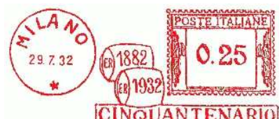
Afb. 7: Roodafstempeling naar aanleiding van het 50-jarig bestaan van de firma Reinach in 1932