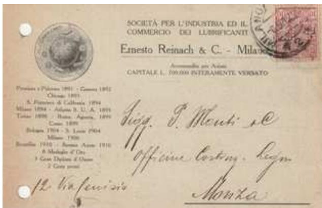
Afb. 2: kaart met E.R.-perfin uit 1912

De kaart laat zien dat het bedrijf op verschillende tentoonstellingen is geweest en daar diverse prijzen heeft behaald.