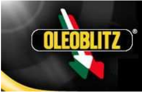
Afb. 5: Oleoblitz-logo

Door te adverteren in de autoatlassen van de Italiaanse Touringclub kreeg het bedrijf grote bekendheid (zie afbeelding 4).