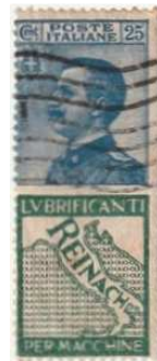
Afb. 6: postzegel met reclameaanshangsel

Ernesto kreeg de titel van Groot Officier en werd in 1932 benoemd tot Ridder van de Arbeid.