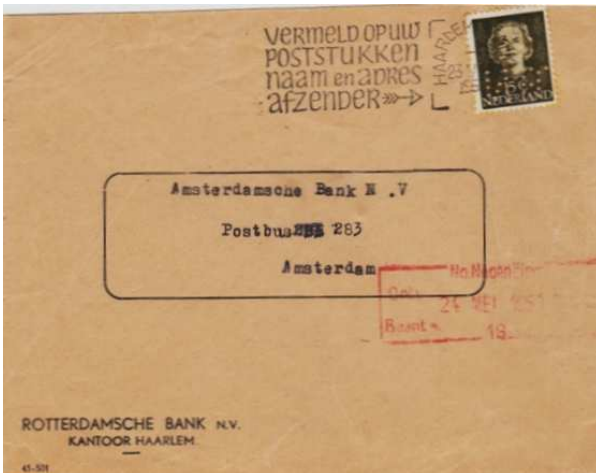
Afb. 8: Vanaf 1947 Rotterdamsche Bank maar toch nog steeds de perfin NBV

De RBV heeft in 1947 de oude naam "Rotterdamsche Bank" weer aangenomen.