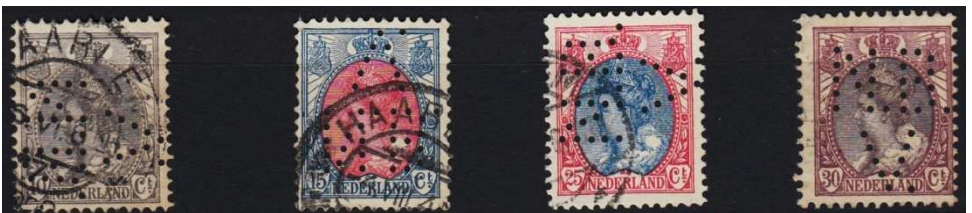
Afb. 5: Voorbeelden van de oudste perfins NBV-Haarlem

De NBV-kantoren hebben hun perfins niet alleen zelf gebruikt. In veel gevallen hebben ze ook hun correspondentschappen van perfins voorzien. De correspondentschappen zijn later vaak kantoren geworden. Dan eindigde het gebruik van de perfins van het kantoort waaronder ze tevoren geressorteed hadden. Een groot aantal is echter lang als correspondentschap blijven bestaan. De kans dat NBV-perfins worden aangetroffen die niet zijn afgestempeld in de plaats van het kantoort maar in die van één van dergelijke lang bestaande correspondentschappen is vrij groot.