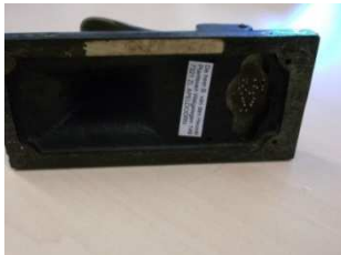
Afb. 1: de NBV-perforator

In 1922 hebben alle "kantoren" een perfinapparaat van het type 13.12.9. gekregen. De stempels van die apparaten zijn kennelijk met de hand gemaakt. Ze zijn allemaal verschillend zodat elk kantoor een perfin had met eigen kenmerken. De verschillen zijn vaak klein maar soms ook springen ze direct in het oog. Voorbeeld van dit laatste zijn de hieronder weergegeven perfins van