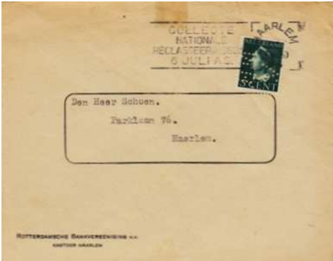
Afb. 4: Vanaf 1929 Rotterdamsche Bankvereniging kantoort Haarlem maar nog wel de perfin NBV

De NBV-kantoren hebben hun perfins niet alleen zelf gebruikt. In veel gevallen hebben ze ook hun correspondentschappen van perfins voorzien. De correspondentschappen zijn later vaak kantoren geworden. Dan eindigde het gebruik van de perfins van het kantoort waaronder ze tevoren geressorteed hadden. Een groot aantal is echter lang als correspondentschap blijven bestaan. De kans dat NBV-perfins worden aangetroffen die niet zijn afgestempeld in de plaats van het kantoort maar in die van één van dergelijke lang bestaande correspondentschappen is vrij groot.