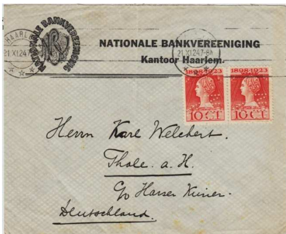
Afb. 3: Nationale Bank Vereniging, kantoor Haarlem.

Na 1922 zijn geen nieuwe perfinapparaten van dit type meer verstrekt. De 2 NBV-kantoren die daarna nog zijn geopend (Nijkerk. en Zaandam) hebben andere NBV-perfins. Daarna was het met de NBV gedaan. In 1929 was kennelijk voldoende gebleken dat het experiment geslaagd was en kon de RBV op eigen naam worden voortgezet. De NBV staakte haar werkzaamheden en de zaken werden door de RBV overgenomen. De oude NBV kantoren zijn hun NBV-perfins echter onveranderd blijven gebruiken (met uitzondering van Schagen), maar de nadien aangeschafte nieuwe perfinapparaten zijn alle van het RBV-type.