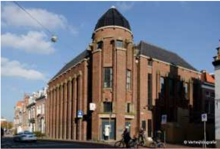
Afb. 10: Het NBV-gebouw in Haarlem

Het pand is versierd met een aantal zandstenen reliëfs die vermoedelijk door Hildo Krop zijn gemaakt.