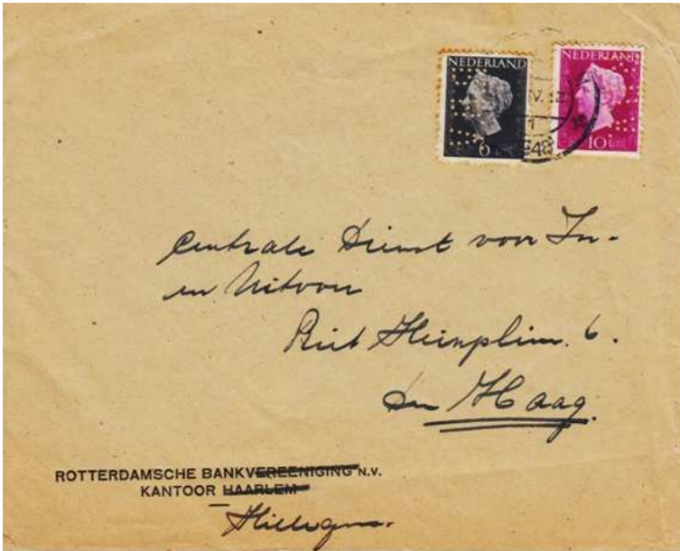
Afb. 9: In 1948 gebruikte Hillegom nog steeds oude enveloppen van Haarlem.

De verbondenheid tussen het kantoor Haarlem en het kantoor Hillegom blijkt wel uit bovenstaande brief. Kantoor Hillegom gebruikt zelfs in 1948, 8 jaar na 'promotie' van correspondentschap naar eigen kantoor, nog steeds oude enveloppen van het kantoor Haarlem. Wel is daarbij de toevoeging Vereeniging doorgestreept en de Haarlem vervangen door een geschreven Hillegom.