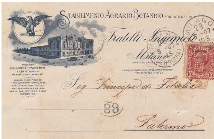
Afb. 1: Briefkaart met de perfin F.I./M., gedateerd 29-03-1907

Het bedrijf heeft drie verschillende perforators gehad welke na elkaar gebruikt werden. Vanaf 1895 tot 1901 F.I. daarna van 1901 t/m 1909 F.I./M. en tot slot van 1910 t/m 1935 weer F.I. maar nu met een rechte onderstreep van de F.