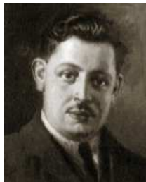
Afb. 2: Guiseppe Tomasi di Lampedusa

De 1 e kaart (zie afbeelding 1) is afgestempeld op 28 maart 1907 om 10 uur 's avonds in het treinpostkantoor van Milaan. Hij is voorzien van een 10 centesimi postzegel wat de juiste frankering is voor binnenlands gebruik. De zegel is voorzien van de perfin F.I./M. De kaart is bij aankomst te Palermo afgestempeld op 31 maart 1907 en bezorgd bij de 11 e Prins van Lampedusa door bezorger nr. 89 die zijn stempel erop zette. De geadresseerde was Giulio Maria Tomasi Prins van Lampedusa die in het Palazzo Mirto te Palermo woonde.