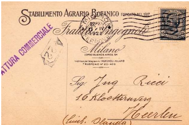
Afb. 2: Briefkaart met de perfin F.I., gedateerd 11-04-1922