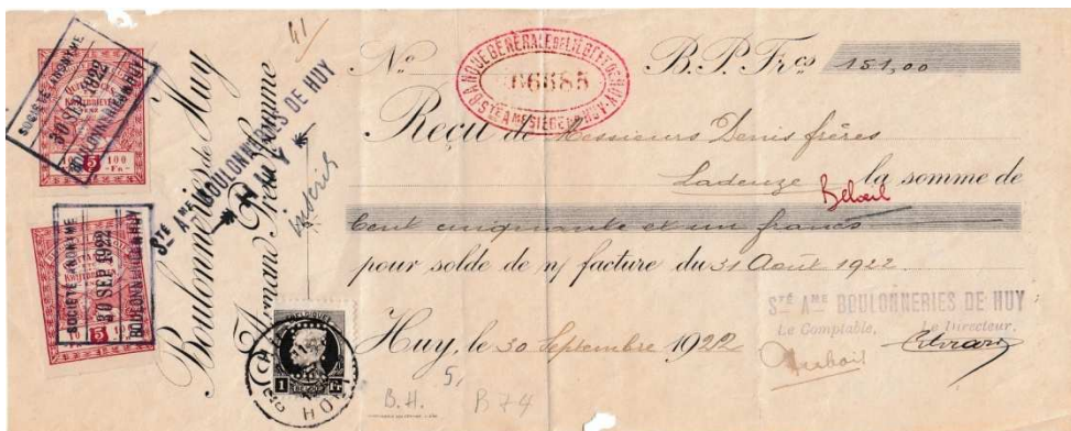
Afbeelding 1: kwitantie van de Boulonneries de Huy

Onlangs is een kwitantie gevonden met deze perforatie BH en daar staat als gebruiker de naam Boulonneries de Huy (zie afbeelding 1). Volgens mij is dat de juiste naam van de gebruiker van de perfin BH mede ook omdat er nooit een bewijs is geweest dat het de Banque de Huy is.