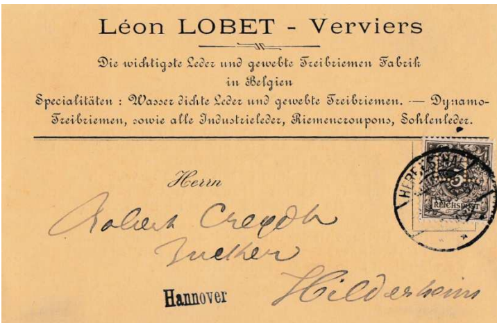
Afbeelding 3: perfin L.L. van Léon Lobet in een Duits zegel

Het derde is L.L. (L48): deze Belgische perforatie is te zien in een zegel van Duitsland (zie afbeelding 3). De verklaring hiervoor is dat het bedrijf dicht bij de Duitse grens zat en het goedkoper was om het poststuk in Duitsland op de bus te doen dan het internationaal tarief van België te betalen. De perfin is dus niet geperforeerd in Duitsland, maar in België, en op een briefkaart gepost in Duitsland.