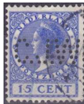
Afb. 1: de perfin CJW 2)

De wolhandel was destijds erg belangrijk voor de Tilburgse textielindustrie. Er werden zaken gedaan met bedrijven in Nederland, Engeland, België, Duitsland en vanuit Nieuw-Zeeland werd veel wol geïmporteerd. Het ging vooral om diverse wolsoorten als grondstof voor de textielindustrie. Daarnaast werd door de TVB bewerkte wol als halffabriekaat geëxporteerd naar allerlei bedrijven in binnen- en buitenland.