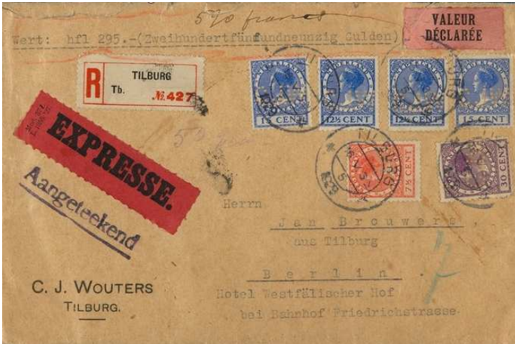
Afb. 2: brief met perfins van de firma C.J. Wouters uit mei 1929 3)

De firma gebruikte (als eigenaar van het bedrijf TVB) een groot magazijn aan de Broekhovenseweg op het terrein van de TVB als opslagplaats. Dat magazijn bestaat nog steeds, daarop zal ook nog in een ander artikel over de TVB worden teruggekomen.