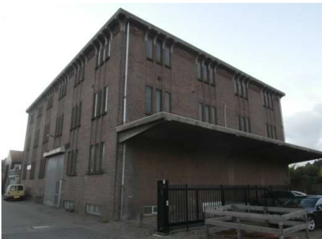
Afb. 3: het magazijn van de TVB aan de Broekhovenseweg in Tilburg 4)

De firma gebruikte (als eigenaar van het bedrijf TVB) een groot magazijn aan de Broekhovenseweg op het terrein van de TVB als opslagplaats. Dat magazijn bestaat nog steeds, daarop zal ook nog in een ander artikel over de TVB worden teruggekomen.