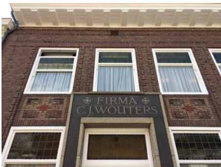
Afb. 5: tekst boven de voordeur van het pand aan de Willem II-straat 29a. 4)

Boven de deur van het pand met nummer 29a is nu nog de tekst 'Firma C.J. Wouters' te lezen (zie afbeelding 5).