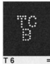
Afb.2: de perfin TC/B