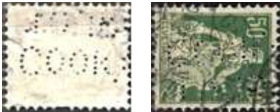
Afb. 1: COOK TOURS in Zwitsers zegel

Omdat het nogal Engels klonk heb ik Stef Netten ernaar gevraagd. Vrijwel per kerende post kreeg ik antwoord. In de Engelse catalogus komt nr. 5580.01 precies overeen met de gezochte perfin (zie afbeelding 3).