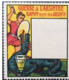
Afb. 6: Door de tweetaligheid zal deze (met een mooie draak) ook Zwitsers zijn.