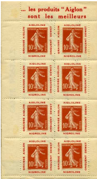
Afb. 5: Aiglon, leverancier van oliën en vetten, vindt zijn producten uiteraard het beste.

De Porte Timbre komt in meer vormen en maten voor. Naast het velletje van acht (zie afbeelding 5), een postfrisje zonder opgeplakte postzegel (zie afbeelding 6) en zelfs uit Uruguay randen met vele reclames en postzegels met perfins, zoals C I / D A (zie afbeeldingen 7 en 8).