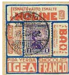
Afb. 8: Diverse thema's in de rand en verschillende postzegels en tarieven in het midden.