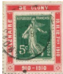
Afb. 2: Ook de organisatoren van het eeuwfeest in Cluny vragen zo de aandacht.

Dus naast de postzegel, of eigenlijk in samenhang met de postzegel, kan er iets thematisch interessants zijn in tekst of afbeelding. De reden van dit artikel is echter dat in een Zwitserse Porte Timbre, waarvan de postzegel helaas is afgeweekt, een perfin zit. Waarom?