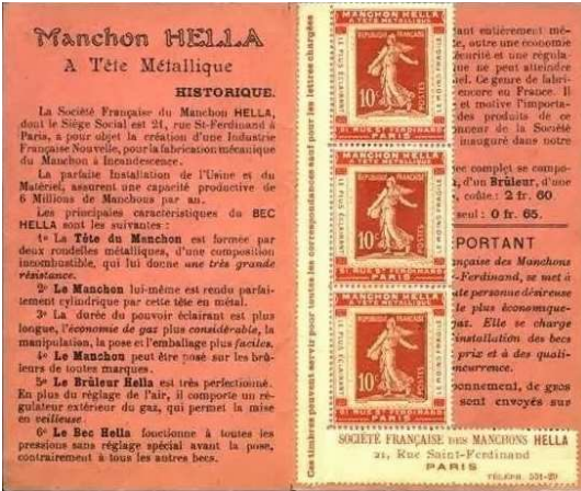
Afb. 3: HELLA Verlichting gebruikt de binnenzijde van het boekje voor extra reclame.

Op de voorkant van het voorbeeld staat met andere woorden zes halen, vijf betalen (zie afbeelding 4). Omdat de postzegel op de drager is vastgeplakt, wordt de drager samen met postzegel en dankzij de gom achterop de drager, vastgeplakt op de te verzenden brief.