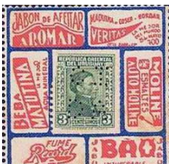
Afb. 7: Hier lijkt een reclamebureau anderen te hebben geïnteresseerd voor kleine annonces.