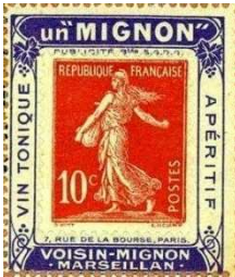
Afb. 1: Veel Franse Porte Timbres maken reclame voor drank, hier alvast een aperitiefje.

Voor een thematische verzamelaar kan een Porte Timbre, een postzegeldrager, interessant zijn. Zo'n gegomd en meestal getand vignet is groter dan een postzegel, omdat de zegel centraal op de drager wordt geplakt, zodanig dat aan drie of vier randen nog de reclame zichtbaar is voor commerciële (zie afbeelding 1), politieke of andere doeleinden (zie afbeelding 2).