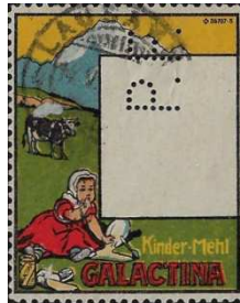
Afb. 10: De Zwitsers hebben een geheel eigen bont gekleurde stijl, zie ook afbeelding 6.

Inderdaad geen postzegel, maar alleen de drager. Hij verzamelt niet thematisch, alleen perfins van oud-Duitsland, dus een ruil met mij was snel gemaakt. De drager toont weliswaar met de Zwitserse Alpen, de koe op een alm en het kind dat een bord kindermeelpap van het merk GALACTINA laat omklappen geen thema voor mijzelf, maar het exemplaar intrigeerde me toch.