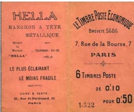
Afb. 4: 50 In plaats van 60 centimes; als 1522 een volgnummer is blijkt zo'n boekje populair.

Op de voorkant van het voorbeeld staat met andere woorden zes halen, vijf betalen (zie afbeelding 4). Omdat de postzegel op de drager is vastgeplakt, wordt de drager samen met postzegel en dankzij de gom achterop de drager, vastgeplakt op de te verzenden brief.