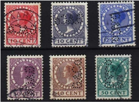
Afb. 3: G&Co in de Veth-serie met Wilhelmina