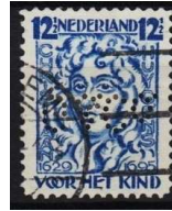
Afb 4: G&Co in kinderzegel 1928

Zeer zeldzaam zijn deze perfin in de kinderzegels van 1928 en de Rembrandt-serie.