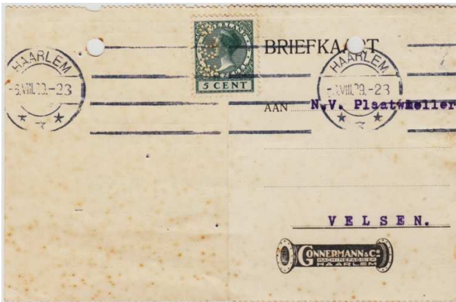
Afb. 5: Poststuk met perfin G&Co uit 1923

De afdeling van de Gebr. Stork, "Stork Hijsch" in Hengelo, opgericht in 1898, werd in 1932 naar Haarlem overgeplaatst om daar aan de oostkant van het Spaarne in een leegstaande fabriek (ex Gonnerman) verder te gaan met de bouw van steeds grotere kranen. Tevens werd alles van de Conrad naar dit terrein verhuisd met uitzondering van de werf zelf. In 1937 werd door Conrad besloten deel te nemen in een samenwerkingsverband (Industriële Handels Combinatie (IHC) Den Haag ) met de werven J. & K. Smit Kinderdijk, Gusto Schiedam, Verschure Amsterdam en L. Smit & Zoon Kinderdijk, waar later De Klop Sliedrecht nog bij kwam. De inbreng van de werf Conrad was het Conrad laboratorium: het MTI in Delft (Dit laboratorium is nog steeds aanwezig bij de IHC in Kinderdijk).