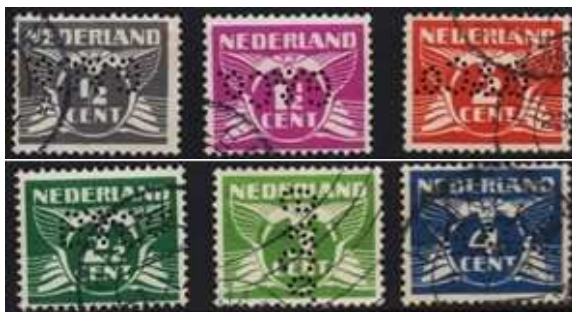
Afb. 2: G&Co in de Veth-serie met vliegende duif