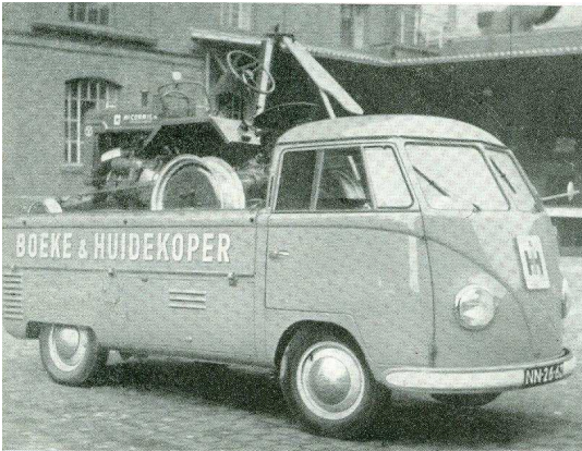
Afb. 5: een busje van Boeke & Huidekoper met een tractor erop

Catalogus Landbouwwerktuigen 1916, Boeke en Huidekoper 'Die vroeg koopt, koopt goedkoper dan hij, die uitstelt' : Ploegen, grondbewerkingswerktuigen, zaaimachines, maaimachines, hooibewerkingsmachines, motoren, dorsmachines, graanmaalmolens, melkemers, enz.