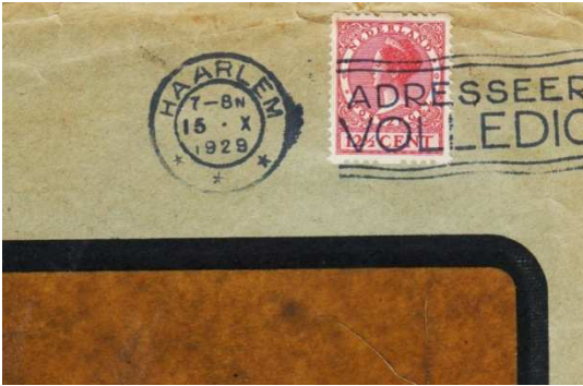
Afb. 12: poststuk, waarschijnlijk afkomstig uit de POKO-machine van Boeke en Huidekoper