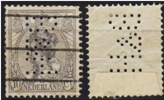
Afb. 10: zegel met rechts onderaan een las

De rollen werden gemaakt door vellen in stroken te scheuren en die vervolgens met behulp van een stukje van de velrand aan elkaar te plakken tot één lange rol. Deze lassen vinden we nu nog terug op sommige zegels.