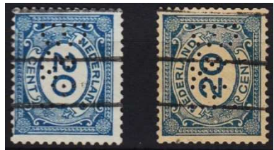
Afb. 11: voorbeeld van kopstaande perforatie

Ook kwam het voor dat bij het maken van de rol één, enkele of alle stroken op z'n kop werden verplakt. Gevolg daarvan was dat er een aantal zegels met een kopstaande perforatie ontstonden.