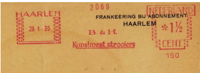
Afb. 14: vroege raadfrankering van Boeke en Huidekoper