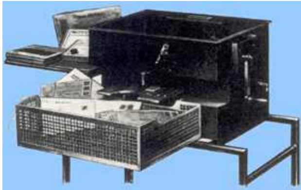
Afb. 8: een POKO-machine

Deze perfin is van het type POKO. De perforatie werd niet aangebracht door enkelvoudige of meervoudige losse perforator maar door een machine zoals hieronder afgebeeld.