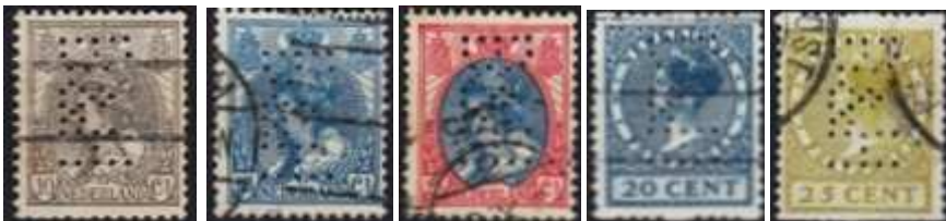
Afb. 9: vijf B&H-poko's met gelijke stand van de perforatie

Degene die de machine bedient kan instellen van welke rol (dus welke waarde) een zegel geplakt moet worden. Door een draai aan de slinger rechts werd één zegel van de geselecteerde rol geperforeerd, gesneden en direct op de klaar liggende brief geplakt. De machine telde het gebruik per rol. Op deze wijze kon iedereen de machine bedienen maar was slechts één persoon verantwoordelijk voor het gebruik van de zegels.