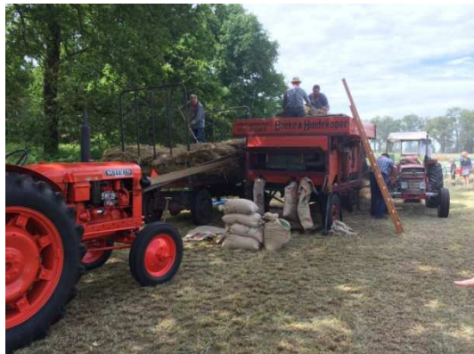
Afb. 6: Ook op hedendaagse shows kom je materiaal van deze firma tegen: dorskast op boerderij Groot Zandbrink tijdens de Hooiday 2018. Dorskas van de firma Boeke en Huidekoper, aangedreven door een Nuffield Universal tractor

Catalogus 1964 BOEKE landbouwwerktuigen: Grondbewerkingswerktuigen, weideslepen, gierpompen, Standard (zelfladende) wagens, kunstmeststrooiers, zaaimachines, rijendunners, pootmachines, hooischudders, sorteermachines, aardappelrooimachines, e.a.