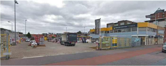
Afb. 3: Bouwcenter Filippo aan de Spaarndamscheweg

Het bedrijf hield zich bezig met werktuigen voor landbouw, zuivel en electrotechniek. Dat blijkt ook duidelijk uit de gevonden advertenties en afbeeldingen.