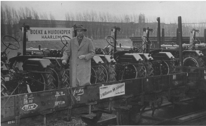
Afb. 4: landbouwtractoren van Boeke & Huidekoper

Het bedrijf hield zich bezig met werktuigen voor landbouw, zuivel en electrotechniek. Dat blijkt ook duidelijk uit de gevonden advertenties en afbeeldingen.