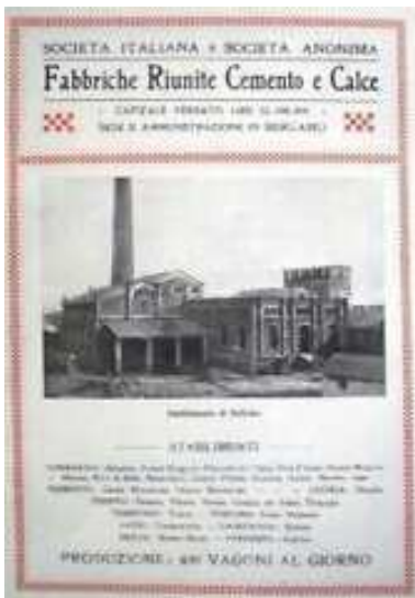
Afb. 3: de cement- en kalkfabriek in Bergamo