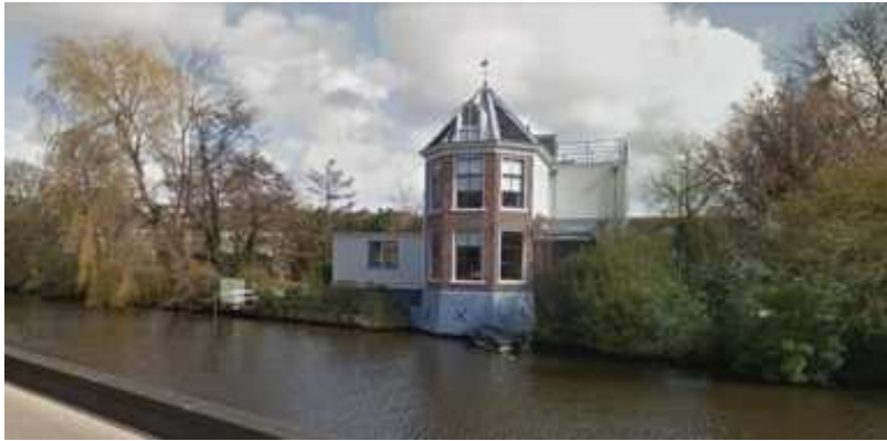
Afb 1: Hofstede Zwanenburg langs de Leidse Trekvaart

De firma C.G. van Tubergen werd in 1868 opgericht door de gebroeders Cornelis en Marinus van Tubergen, oorspronkelijk uit de tabakshandel in Amsterdam afkomstig. Zij kochten samen met hun vader de hofstede 'Zwanenburg', te midden van de weilanden gelegen aan de Leidse Trekvaart buiten Haarlem (zie afbeelding 1).