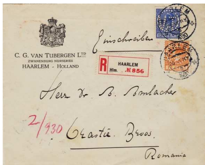
Afb. 7: brief met twee VT-perfins gedateerd juni 1930 naar Roemenië