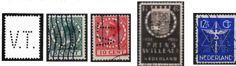
Afb. 5: de perfin VT

Het bedrijf heeft van vanaf 1928 tot in 1937 de perfin VT gebruikt. Een aantal voorbeelden hiervan ziet u hier.