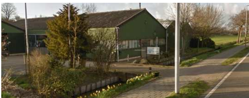
Afb. 3: Van Tubergen is nu gevestigd aan de Leidsevaartweg in Heemstede

Met eigen kwekerijen in Haarlem, Heemstede en Hillegom had Van Tubergen ongetwijfeld het allergrootste assortiment bijzondere bol- en knolgewassen en vaste planten. Na een aantal veranderingen is Van Tubergen nu al 7 jaar aan de Leidsevaart te Heemstede gevestigd en een begrip voor kwaliteits- bloembollen en -planten (zie afbeelding 3).