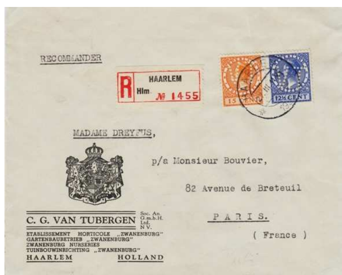
Afb. 6: brief met twee VT-perfins gedateerd maart 1930 naar Parijs

De brieven tonen aan dat het bedrijf ook in die tijd al duidelijk internationaal gericht was (zie afbeeldingen 6 en 7).