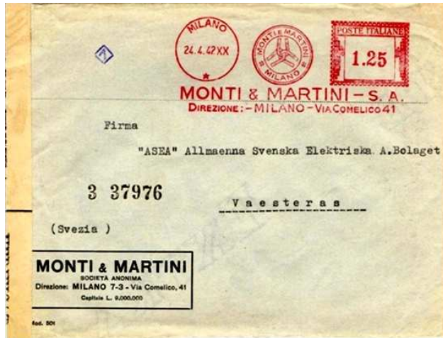
Afb. 3: brief met afstempeling door frankeermachine uit 1942

In 1938 wordt deze frankeermachine vervangen door de SIMA-mod. Italië matr. 1484. Dit stempel is te zien op de brief welke naar Zweden ging naar de Firma "ASEA" een afkorting van Allemaenna Svenska Elektriska A.Bolaget te Vaesteras. (zie afbeelding 3).