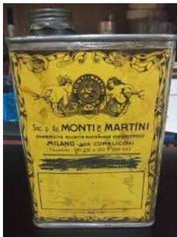
Afb. 4: een ander blik van de firma Monti & Martini

De brief is door de Italiaanse censuur geopend en weer afgesloten met een censuurstrook met de tekst: Verificato per Censura. De sensor heeft zijn stempeltje 7 op de voorkant gezet. Het censuurkantoor heeft afgestempeld met nr.3 37976.