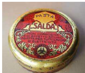
Afb. 3: Op het ronde blikje staat "Niet roestend en veilig. Geschikt voor elektriciteitsbescherming."

De heer Pietro Donati werd medegedeeld dat zijn bestelling klaar staat om geleverd te worden. Op de kaart wijst de heer Monti naar het blik waarin "Polvere Acciaiante" zit (staalpoeder). Het bedrijf fabriceerde isolerend materiaal ook wel "diëlektrisch" genoemd zoals aluminium- en tantaaloxide alsmede plastic materialen.