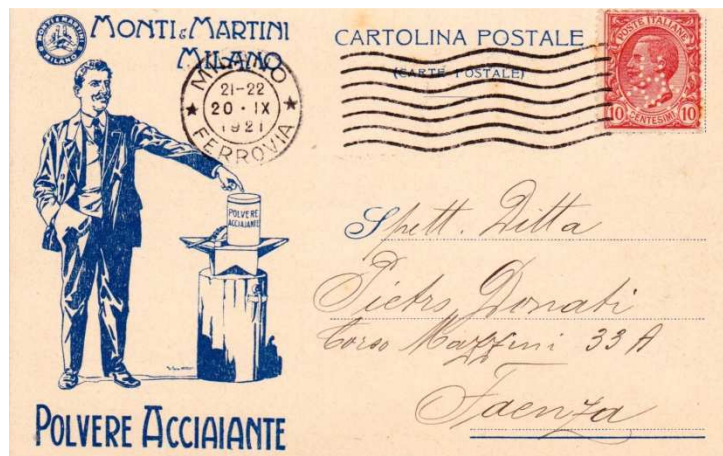
Afb. 2: Briefkaart van de fa. Monti & Martini met perfin uit 1921

De kaart is afgestempeld Milano Ferrovia (station) 's avonds tussen 21.00 en 22.00 uur op 20 september 1921. Met als stempelvlak 7 golflijnen.