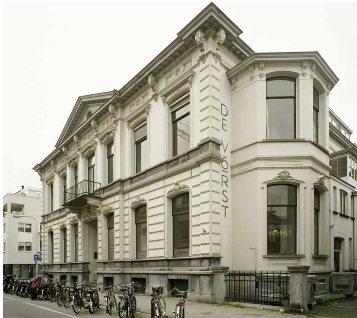
Afb. 4: het pand aan de Willem II-straat, door de Bredase Courant uit 1891 het "fraaiste huis van gansch Tilburg" werd genoemd. Het is een rijksmonument en heet nu Cultureel Centrum 'De Nieuwe Vorst'. 6)

Het lijkt erop dat de verhuizing van de Heuvel naar de Willem II-straat ervoor gezorgd heeft dat de BVS-perforator niet langer gebruikt werd.