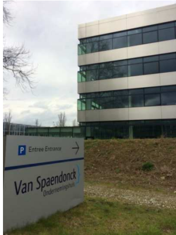
Afb. 8: het Van Spaendonck 'Ondernemingshuis' aan het Reitseplein. 9)

In oktober 1967 verhuisde Bureau Van Spaendonck naar een nieuw kantoorpand aan het Reitseplein, waar het nu nog gevestigd is (zie afbeelding 7.)