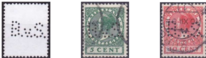
Afb. 2: de perfin BVS, die gebruikt werd van 1925 tot 1932 4)

Ook het secretariaat van de Kamer van Koophandel werd hier gevestigd. Waarom dit pand 'Maison Boes' werd genoemd is niet bekend. Het pand werd in 1931 onderdeel van het ernaast gelegen hotel-café-restaurant Modern. Inmiddels bestaat het niet meer. Op deze locatie op de hoek van de Heuvel en de Spoorlaan werd later het nieuwe kantoor van ABN-AMRO gebouwd.