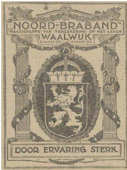
Afb. 4: advertentie in de Provinciale Noordbrabantsche en 's Hertogenbossche Courant in 1918 5)

In 1918 werd het 75-jarig bestaan van de verzekeringsmaatschappij gevierd.