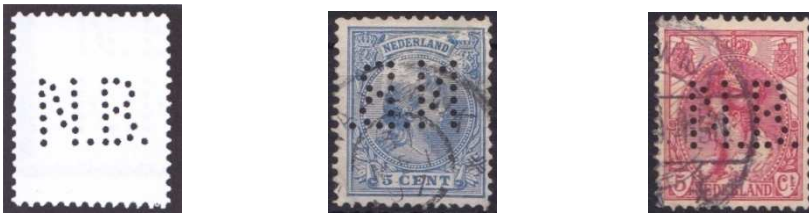
Afb. 3: de perfin NB 4)

De verzekeringsmaatschappij 'Noord-Braband' gebruikte tussen 1894 en 1930 de perfin NB (zie afbeelding 3).