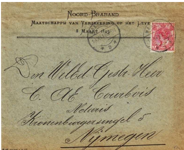
Afb. 5: Brief van de NV Noord-Braband met perfin NB, verzonden op 14-11-1918 6)

In het eerste decennium van de vorige eeuw werden bijkantoren opgericht in Amsterdam, Rotterdam, Den Haag, Utrecht, Eindhoven, Heerlen, Helmond, Hengelo en Nijmegen. Tot 1945 verzorgden zij de ledenadministratie. In dat jaar werd die overgebracht naar het hoofdkantoor in Waalwijk.