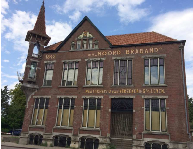
Afb. 9: Het hoofdkantoor van de NV Noord-Brabant in Hollandse stijl , zoals dat er nu bijstaat aan de Grotestraat in Waalwijk 7)

Het gebouw is in de loop van de tijd wel enigszins verbouwd. Met name het rechterdeel, dat vroeger woonhuis was, is bij het kantoor getrokken. (Vergelijk het gebouw op afbeelding 9 met het gebouw op afbeelding 2).