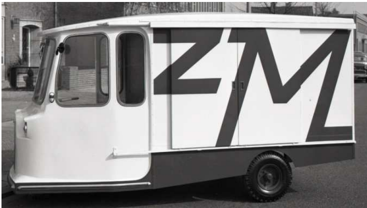
Afb. 10: Elektrische melkcar CTM in 1961. ZM was de afkorting voor Zuid Melk. 2)

Voor het venten van de melk werden in de jaren zestig zowaar elektrische melkkarretjes gebruikt (zie afbeelding 10).