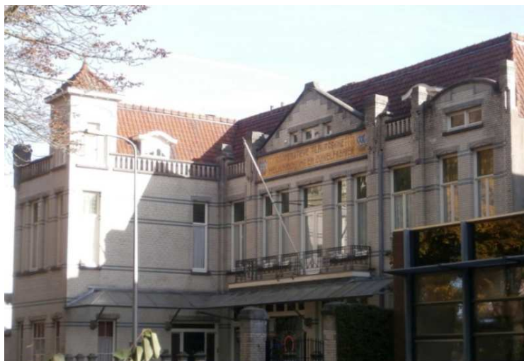
Afb. 8: het CTM-gebouw zoals het er nu uitziet 3)

Aan de buitenkant is dit zichtbaar: de etalageruiten linksonder zijn vervangen door gewone vensters (vergelijk de afbeeldingen 1 en 8).