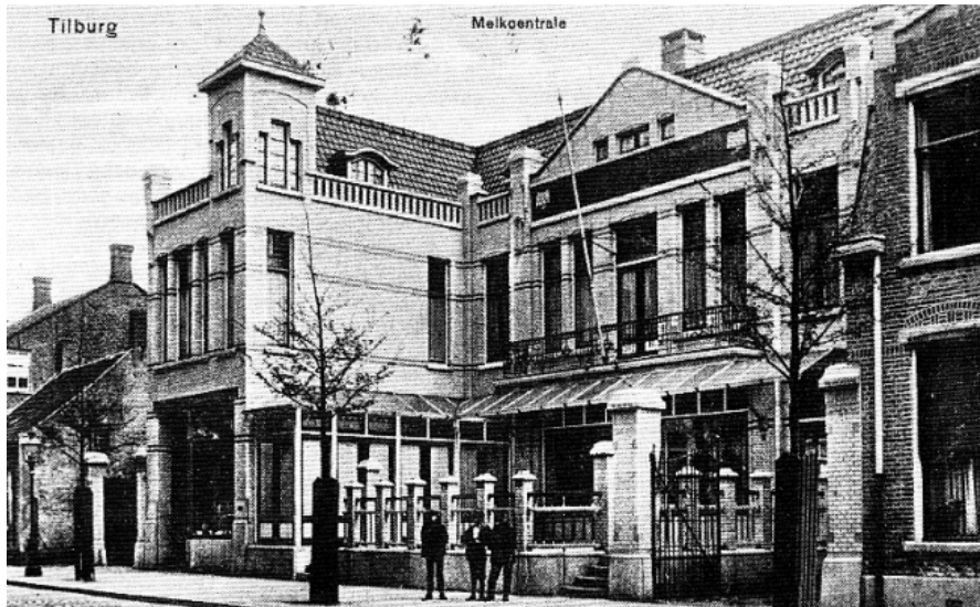
Afbeelding 1: het gebouw van de CTM aan het Wilhelminapark (ca. 1920) 2)