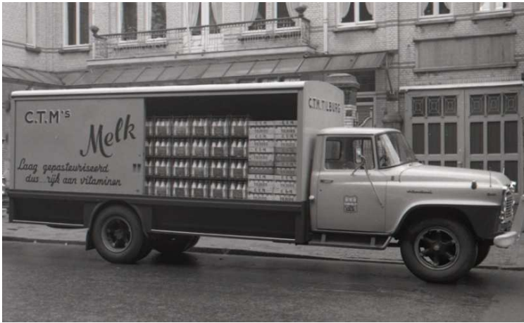
Afb. 9: vrachtwagen van de CTM (ca. 1955) 2)

In de jaren vijftig werd gebruik gemaakt van vrachtwagens om de melkflessen te vervoeren (zie afbeelding 9).