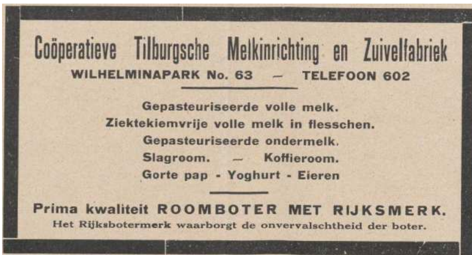
Afb. 5: Advertentie in de Tilburgsche Courant van 31 juli 1926 5)

Gezien de opmerkingen in dit artikel over de export naar Duitsland is het niet onmogelijk dat daar nog ooit een poststuk met de perfin CTM opdrukt.