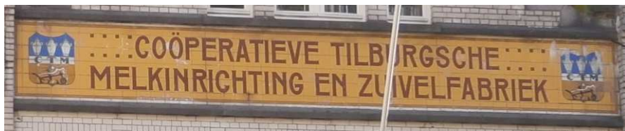
Afb. 2: naam en beeldmerk van de fabriek op de gevel 3)

Op de gevel is de naam en het beeldmerk van de melkfabriek vermeld (zie afbeelding 2)