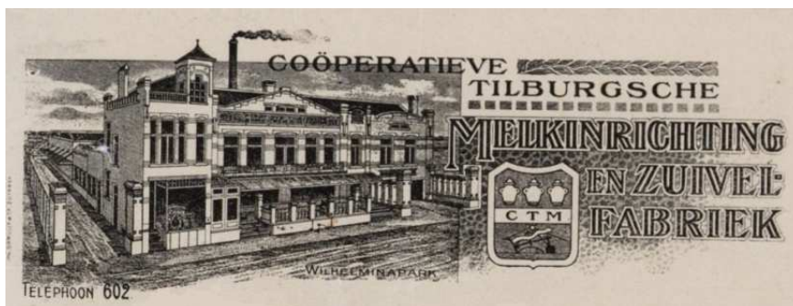
Afb. 3: Briefhoofd van de CTM uit 1918 2)

Bij de opening sprak de burgemeester de hoop uit dat snel alle melkboeren zich zouden aansluiten bij de coöperatie, want dat zou met name goed zijn voor de hygiëne en de volksgezondheid.