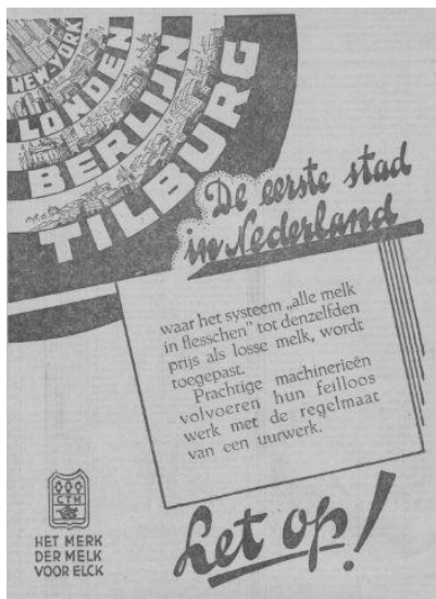
Afb. 6: De ambities van de CTM reikten tot ver over de grenzen, gezien deze advertentie in de Nieuwe Tilburgsche Courant van 23 mei 1931. 5)