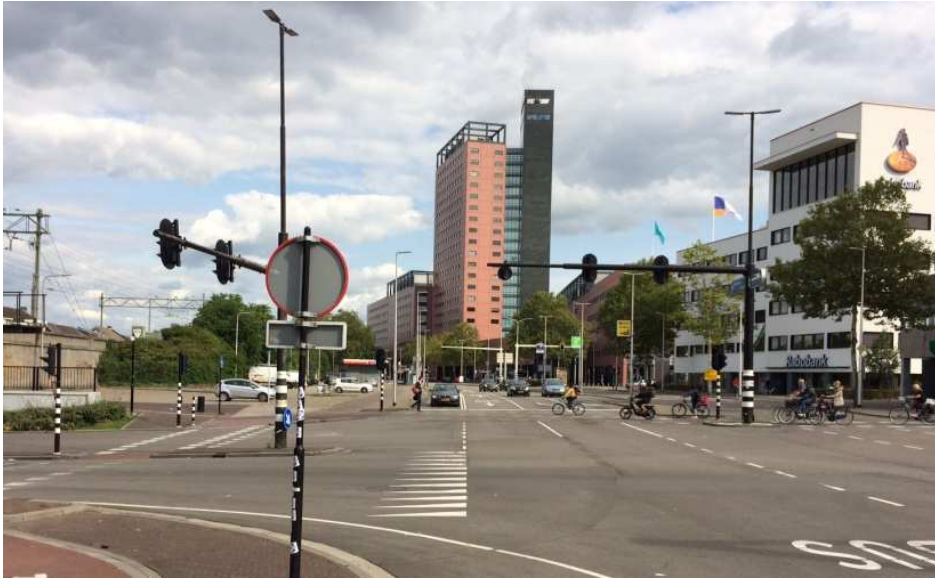
Afb. 8: de plek op de kruising Spoorlaan/Heuvel langs het spoor waar vóór 1964 het fabriekscomplex van de firma F.A. Swagemakers & Zonen stond. 6)