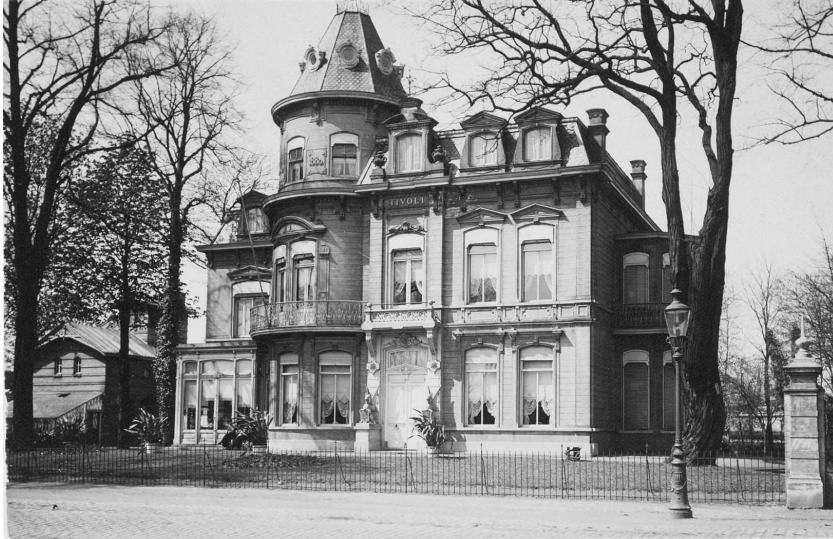
Afb. 3.' Villa Tivoli aan de Bosscheweg 2) De villa werd afgebroken om de aanleg van de Spoorlaan mogelijk te maken.