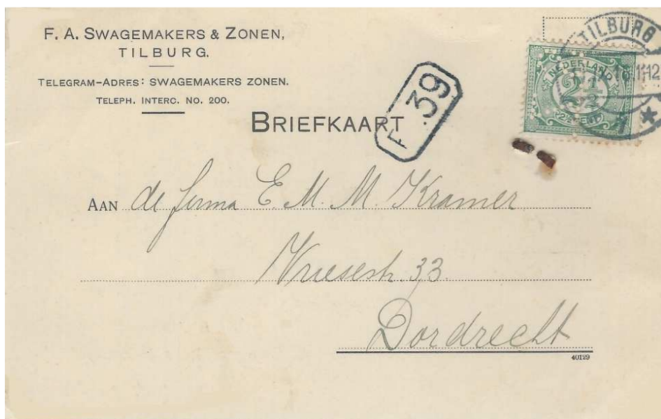
Afb. 6: briefkaart van de firma F. A. Swagemakers & Zonen met de perfin SZ 4, gedateerd 11 september 1916 5)

PCN-lid William Baekers heeft twee dezelfde typen briefkaarten van Swagemakers met de twee verschillende firmaperforaties SZ en BK in zijn collectie***. (zie afbeeldingen 6 en 7)