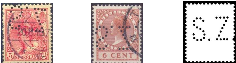
Afb. 5. de perfin SZ 4

Het is eigenlijk zeer opmerkelijk dat de perfin SZ 4 tussen 1913 en 1933 gebruikt is (zie afbeelding 5), want de Beka (gevestigd aan de St. Joseph-straat) was in die periode eigenaar van de fabriek. Hij werd gebruikt ter onderscheiding van de perfin BK 1 van de Beka.