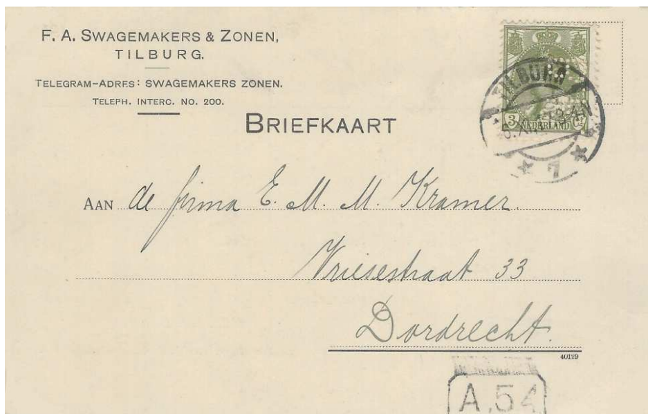
Afb. 7: briefkaart van de firma F.A. Swagemakers & Zonen met de perfin BK 1, gedateerd 6 november 1917 5)

Hij zegt daarover: "Aan de ene kant bijzonder, maar omdat bekend is dat Swagemakers ten tijde van het gebruik van deze briefkaarten al eigendom was van BeKa, toch weer niet zo verwonderlijk. Meest waarschijnlijk is dat Swagemakers op het moment van gebruik van de tweede briefkaart een tekort had aan zegels van 3 cent, of wellicht de 'postzegelboeken' van de twee bedrijven had samengevoegd."