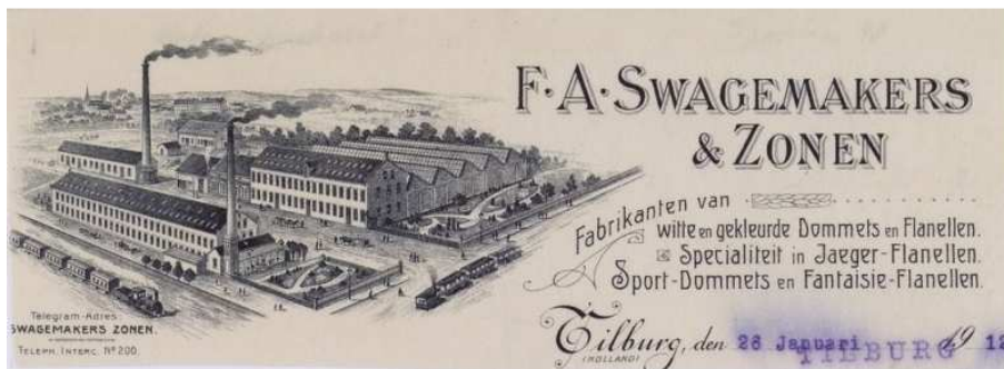
Afb. 4: briefhoofd van de firma gedateerd 26 januari 1912 2)

In 1912 werd de firma Swagemakers & Zonen overgenomen door Beka (van den Bergh-Krabbendam) en als fabriek op dezelfde plek aan de Heuvel met hetzelfde personeel voortgezet. De fabriek was gespecialiseerd in de productie van flanelen stoffen (zie afbeelding 4).