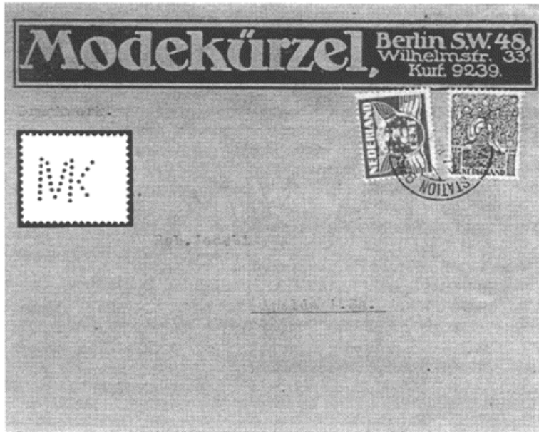
Afb. 1 Brief met perfin MK 3

De frankering bestaat uit de cat.no. 110 en 145. Het tarief voor drukwerk naar het buitenland bedroeg van 1/10/1925 t/m 1/11/1928 3 cent. Omdat het dus een buitenland frankering met Nederlandse zegels was denk ik dat deze firma omstreeks die tijd in Amsterdam gevestigd was of daar een filiaal o.d. had. Ook de andere zegels met deze perfin werden in Amsterdam afgestempeld. In de volgende veiling is dit poststuk te koop.