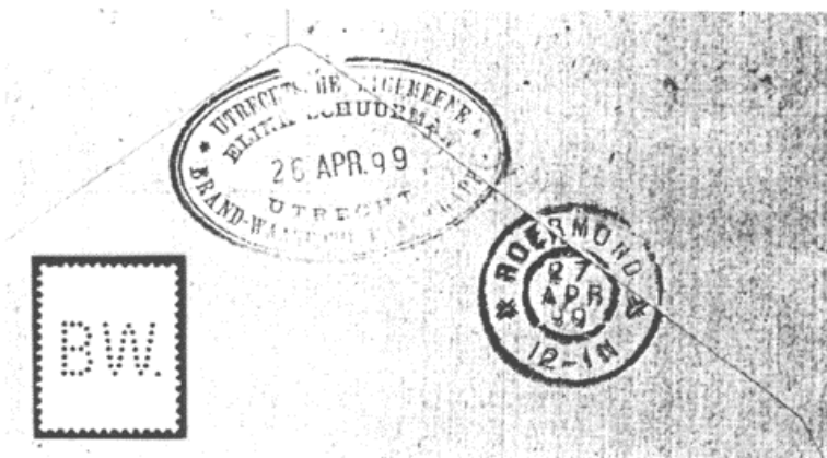
Afb. 2: Achterzijde enveloppe

Van de perfin BW is nu ook de gebruiker bekend geworden. Op een ietwat onduidelijk stempel op de achterzijde van een enveloppe lezen we: Utrechtsche Algemeene Brand-Waarborg Maatschappij Eline Schuurman. Zie afbeelding 2.