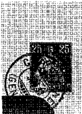
Afbeelding 2. Deel kopie van brief met perfin 'H.C.'.

De perfin 'H.C.' komt overeen met de initialen van de firma. Ook dit keer is er sprake van een bijzonder onregelmatige structuur van de perfin.