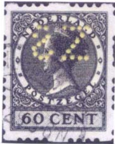
Afb. 9 S in spiegelbeeld!????

Bij de Zeeuwse postzegelveiling werd in 1990 7) een partij valse Poko's aangeboden waarbij de valse SZ in de 60 cent zwart vierzijdige roltanding (zie afbeelding 9).