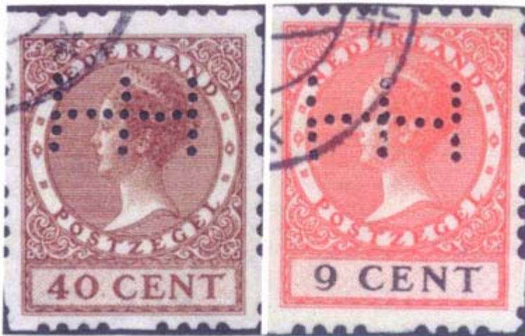
Afb. 10 Handmatig geperforeerd in zegels met verzoekafstempeling.

Ook roltandingzegels met vel- of verzoekafstempeling komen voor, soms nog met onbeschadigde gom en zelf ingeprikte Poko's (zie afbeelding 10).