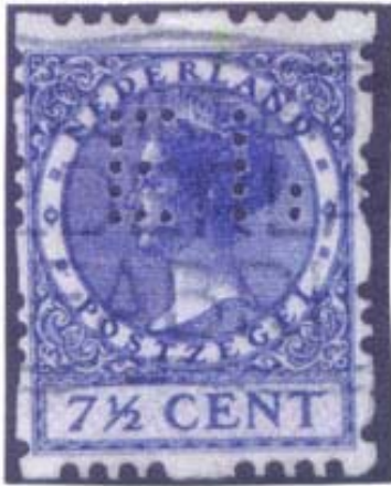
Afb. 11 3-gaats roltanding!!

Verder veel geknoei met de tanden van de roltandingzegels. Waaronder de enige echte Poko die u hierbij ziet in een 3 gaats roltanding !?(zie afbeelding 11)