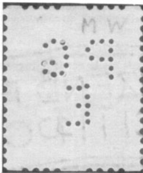
Afb. 4 Verkeerd geprikt gaatjes.

Er was één zegel bij met verkeerd geprikt gaatjes (zie afbeelding 4). Hij maakte ook wel eens een foutje door een gaatje vergeten te maken (zie afbeelding 5).