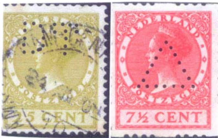
Afb 8 Te kleine diameter van de gaatjes.