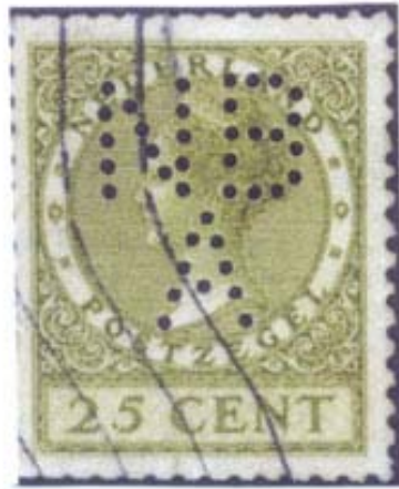
Afb. 12 Cat. nr. 192 B is nooit op rol verstrekt geweest

In de Nederlandse pertincatalogus staan Poko's die ooit wel eens gemeld zijn, maar nog niet zijn teruggevonden, cursief genoteerd. Er blijken 18 valse Poko's tussen te staan (zie afbeelding 12) 8) . In de volgende editie van de catalogus zullen deze worden verwijderd