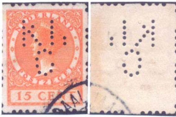
Afb. 3 Links scherpe randjes, rechts afgeronde randjes van de gaatjes.

Een plaatje van perforeren vanaf de achterzijde, waarbij de gaatjes niet helemaal door en door zijn geprikt (zie afbeelding 3).