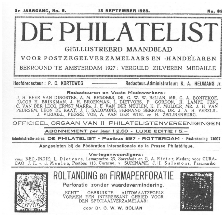
Afb. 1 De Philatelist 13 september 1928

Het verzamelen van Poko's begon al in 1928 n.a.v. een artikel van Bölian in de Philatelist 1) (zie afbeelding 1).