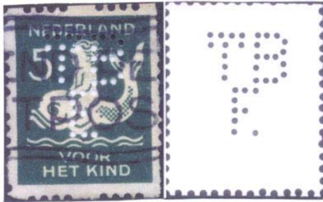
Afb. 6 Bij kindzegel van na december 1929 ontbreekt altijd E3.

Daarbij werd wel eens een gaatje te veel geprikt. In het najaar van 1929 brak bij Pokomachine van de Twentsche Bank TBf de middelste pen onder van de letter E. Latere Poko's zijn allemaal zonder dat gaatje. Door het gebruik van een 'Poko-mal' van vóór die tijd maakte hij een gaatje te veel (zie afbeelding 6).