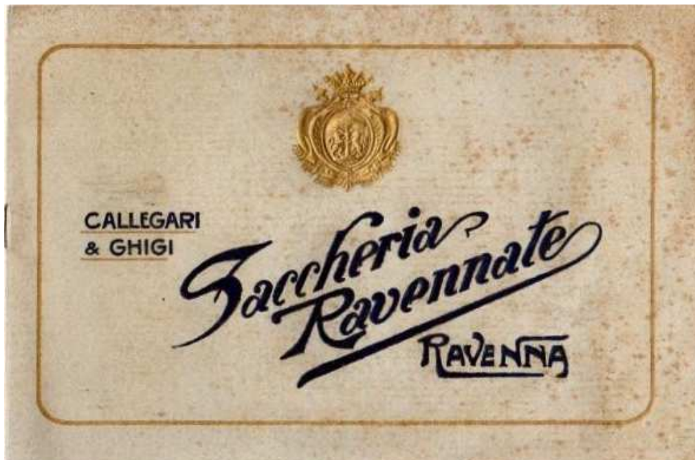
Afbeelding 4: Boekje over de tassen van Ravenna

Het bedrijf is opgericht door Costantino Callegari in 1906 en startte met de verhuur en reparatie van banden en tassen voor de landbouw. In de 1 e wereldoorlog werd begonnen met de productie van waterdichte weefsels, waaronder canvasdoeken voor paarden en regenkleding. Hierna werd de productie van rubberschoeisel (laarzen) gestart. Daarmee werd het bedrijf toonaangevend voor Italië.