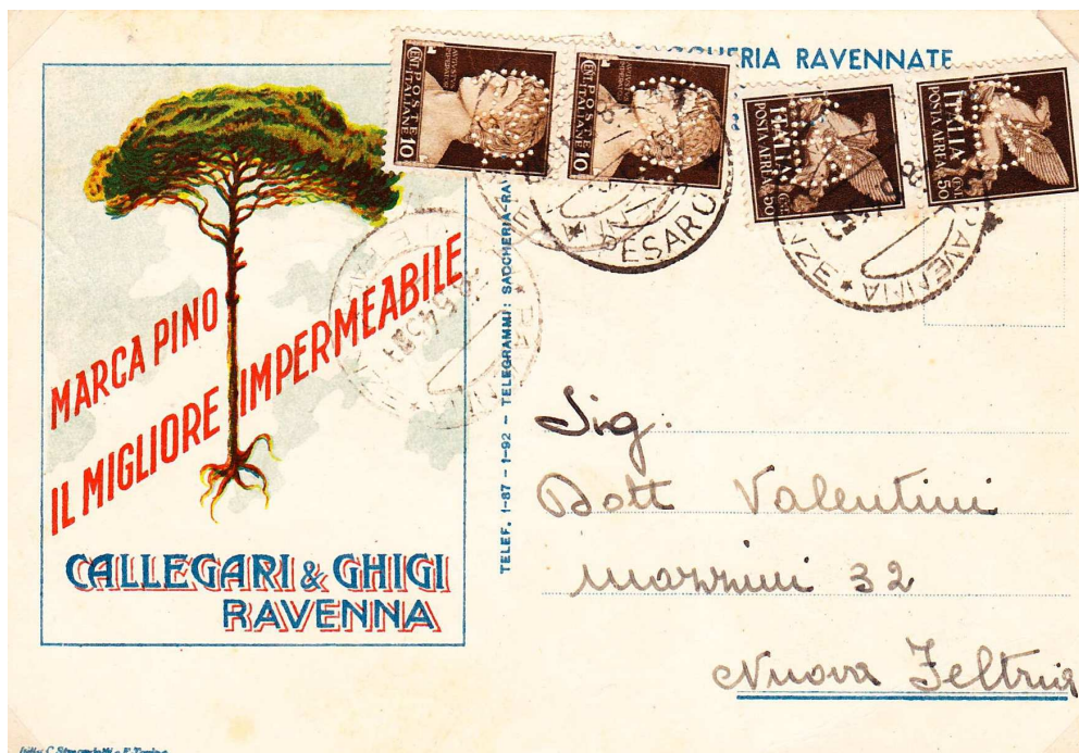
Afbeelding 2: SR-perfinkaart uit mei 1945

De eigenaren van het bedrijf zijn Callegari & Ghigi te Ravenna.