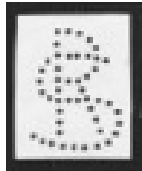
Afbeelding 1: de perfin SR

SR: Afkorting van Saccheria Ravennate. (Tassen van Ravenna)