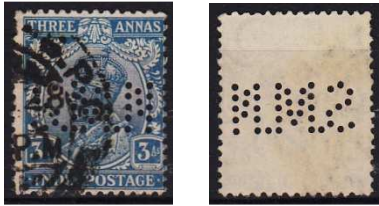
SMN 1 in zegel van India

Van SMN 1 van Nederlandsch Indië is een perfin in een zegel van India gevonden: SG 208.