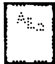
AEG 1 aan het einde van 1930

Vanaf 1928 zijn eerst E9 of G6 en vervolgens ook nog G3 en G4 niet geheel uitgeponst en blijven in de zegel achter.