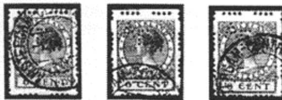
In mei en juni 1939 komen langere zegels voor.