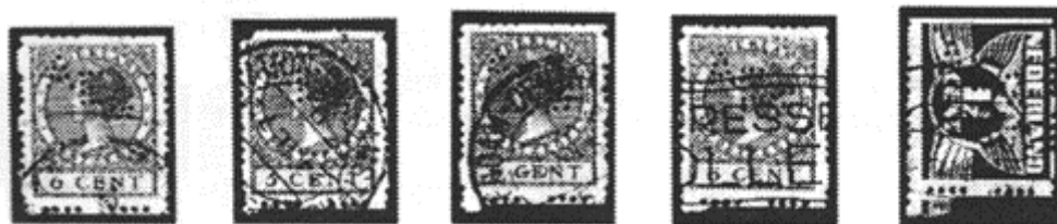
Soms wordt de zegel niet geheel afgesneden.

Van AEG 2 zijn C5 (rt40), C6 (rt41) en C7½ (rt43) "kopstaand" bekend.