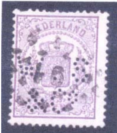
Enig bekende perfin met puntstempel in Rijkswapen

Volgens de nieuwste Perfincatalogus van Verhoeven zouden er 511 theoretisch mogelijke perfins met een puntstempel kunnen voorkomen in 39 perfinen. Echter de inventarisatie heeft ook een aantal nieuwe perfins opgeleverd, die nog niet in de catalogus staan, waardoor op dit moment het theoretische aantal 527 bedraagt. Deze staan in de onderstaande lijst. Van de zegels met een onderstreping is de combinatie perfin / puntstempel bevestigd. Ik vraag u (met vermelding van de tanding (indien van toepassing en liefst een scan) de perfins die nog niet in onderstaande lijst als bevestigd staan, bij mij te melden.