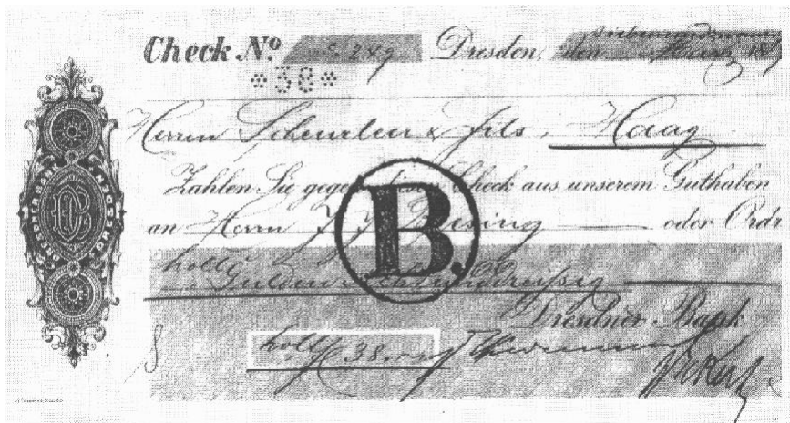
Cheque van Dresdner Bank met perfin sterretje en getal 38

We mogen ervan uitgaan dat hiermee weer een vraagteken ten aanzien van perfins is opgelost.