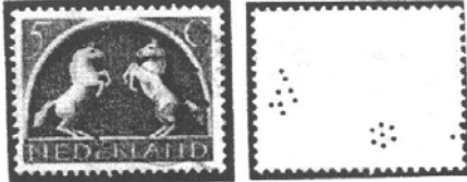
Afb. NVPH nr. 411 met sterretje 2 en cijfer 4

Ook bleek het sterretje meestal niet in het midden van de zegel te zijn geperforeerd, maar aan de zijkant. Hierdoor kwam ik op de gedachte dat dit sterretje een onderdeel zou zijn van een perfin met meer cijfers.