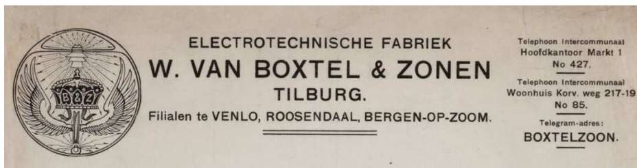
Afb. 2 Briefhoofd van het bedrijf uit 1918 2)

In 1910 werd de eerste Van Boxtel-winkel geopend. Er werden vooral lampen verkocht. Het assortiment van het familiebedrijf werd in de jaren twintig en dertig uitgebreid van de vorige eeuw uitgebreid met radio's in de jaren 50 met televisieapparatuur (zie afbeelding 3).