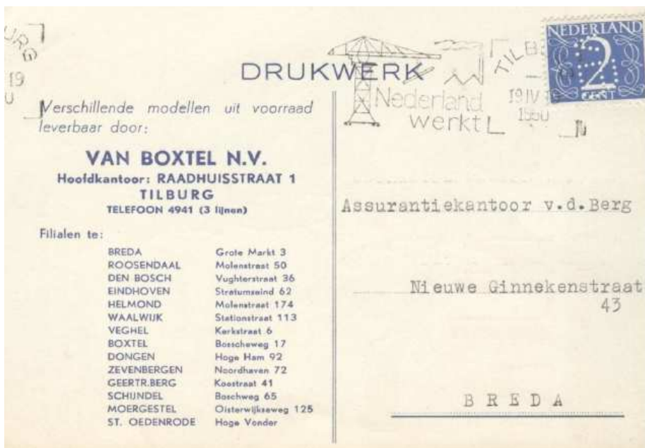
Afb. 8: briefkaart met perfin uit april 1950 met de adressen van 14 filialen 4)

Het winkelbedrijf, dat toen 23 filialen in Brabant had, ging verder onder de naam uit 1910. (Zie ook afbeelding 8).