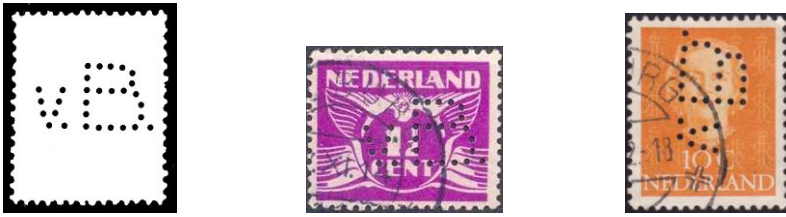
Afb. 4: de perfin VB 2 3)

In de jaren twintig had Van Boxtel een winkel aan de Heuvelstraat voor de verkoop van elektrische apparaten. Vanaf 1931 gaat het bedrijf zijn initialen perforeren in postzegels: de perfin VB 2 (zie afbeelding 4). Dat bleef het doen tot 1952.