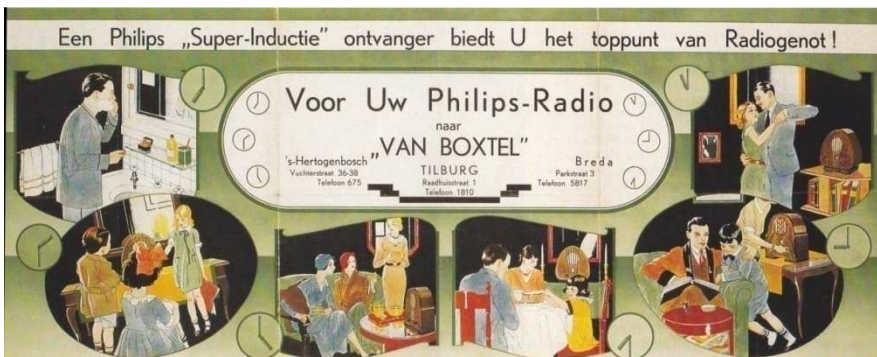
Afb. 6: folder van Van Boxtel waarin met name reclame werd gemaakt voor Philips-radio's. 2)

De activiteiten van Van Boxtel begonnen in de jaren dertig steeds meer te verschuiven naar radio en andere elektronica (zie bijv. afbeelding 6).