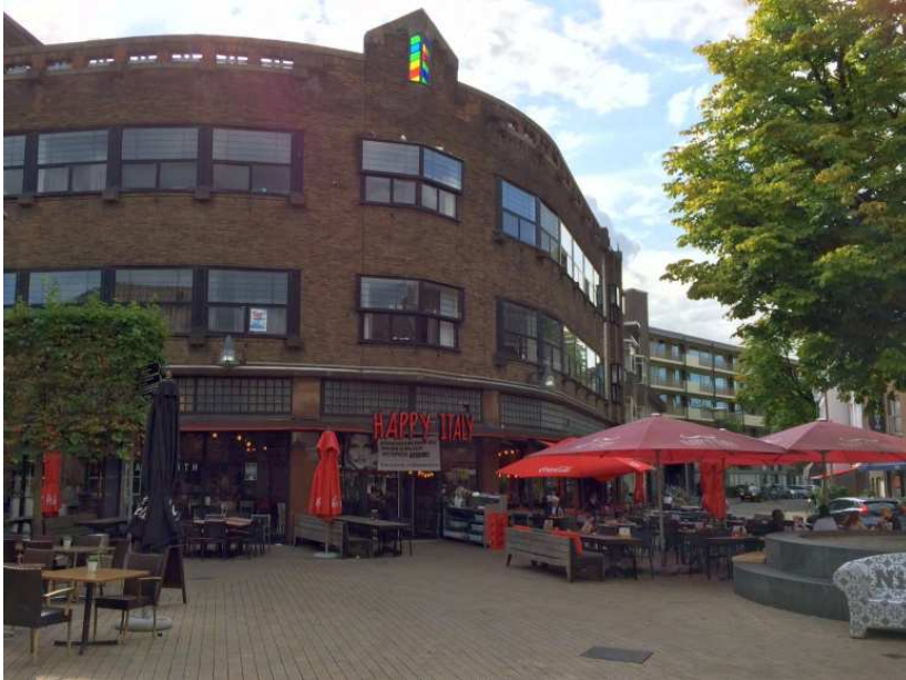
Afb. 9: Het restaurant Happy Italy is nu gevestigd in het vml. Van Boxtel-pand. 5)

In 1992 fuseerde Van Boxtel met andere regionale elektroketens als Turksma, Kok en Wastora onder de naam It's Electric. Tegelijkertijd vond in de regio Rotterdam en Den Haag een vergelijkbare fusie plaats toen Radio Modern, Radio Jacobs, Guco, Elektrorama en Valkenberg fuseerden tot Modern Electronics. In 2000 waren beide concerns onderdeel van Vendex KBB en werden hun logistiek en administratie geïntegreerd ondergebracht in Tilburg. In januari 2005 werd het bedrijf verzelfstandigd als IMPact Retail en gingen alle winkels verder onder de naam It's. Tegenwoordig is in het voormalige pand van Van Boxtel en It's aan de Heuvelstraat, voorheen Raadhuisstraat, een Italiaans restaurant gevestigd (zie afbeelding 9).