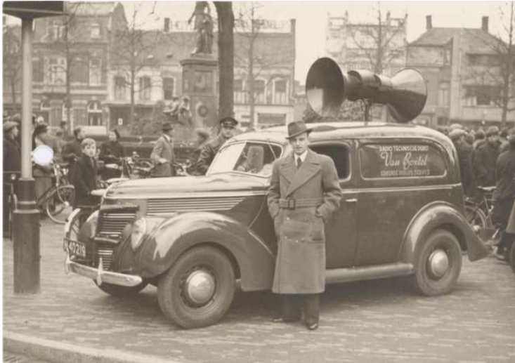
Afb. 7: de Radiodienst van Van Boxtel actief op de Heuvel in Tilburg 2)

In die periode kreeg de firma van de overheid ook goedkeuring om voor Tilburg een radiodistributiedienst op te zetten (zie afb. 7). Deze activiteiten werden in de oorlog, op last van de Duitsers, overgedragen aan de PTT.