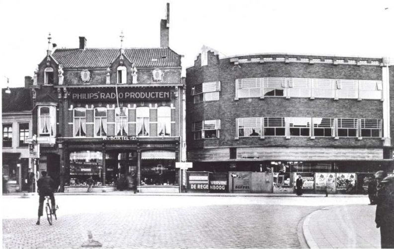
Afb. 5: de oude en nieuwe winkel van Van Boxtel naast elkaar aan de Zomerstraat 2)

In 1933 opende men een nieuw pand pal ernaast aan de voormalige Zomerstraat. Het oude pand werd afgebroken voor de aanleg van de Raadhuisstraat, vandaar dat Van Boxtel vanaf 1933 het adres Raadhuisstraat 1 kreeg. Die straat bestaat inmiddels niet meer. Het nieuwe gebouw werd ontworpen door architect F.C. de Beer. De bouwstijl staat bekend als 'de Nieuwe Zakelijkheid' (zie afbeelding 5).