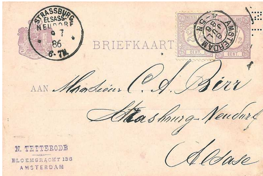
Afb. 1: briefkaart met de perfin N.T., gedateerd 8 juli 1886

Er is een briefkaart opgedoken met de perfin N.T. Volgens de afzender staan die initialen voor N. Tetterode, gevestigd aan de Bloemgracht 136 in Amsterdam (zie afb. 1). Reden voor een zoektocht op internet om te kijken wie deze N. Tetterode was en wat voor bedrijf hij runde. Het blijkt dat het om de koopman Nicolaas Tetterode gaat.