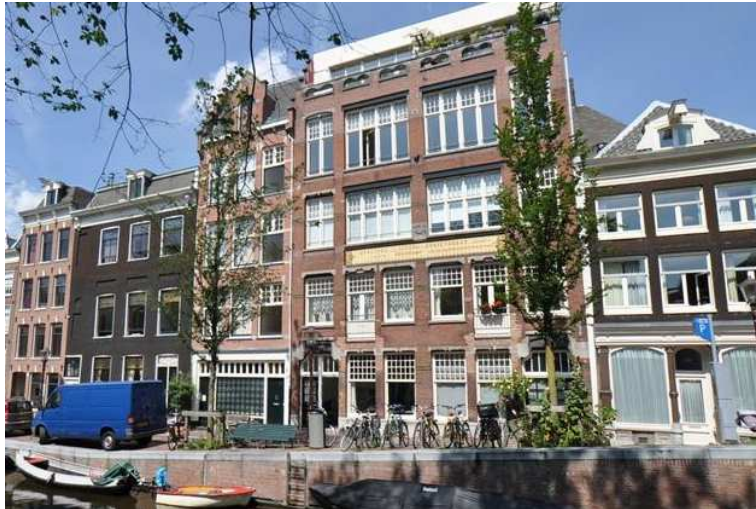
Afb. 3: Het pand aan de Bloemgracht 136 in Amsterdam