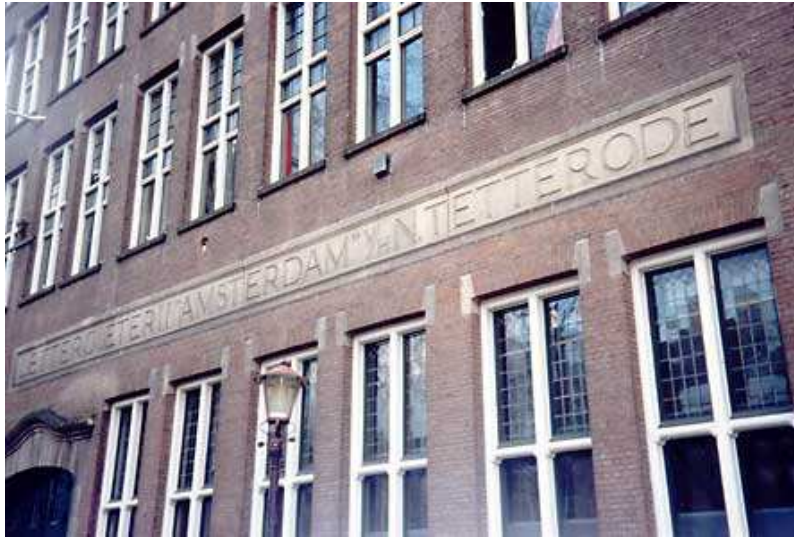
Afb. 4: 'Lettergieterij Amsterdam, voorheen N. Tetterode' aan de Da Costakade in Amsterdam

Nadat hij zich uit het bedrijf had teruggetrokken restten hem nog enkele jaren. In 1894 is hij overleden (zie afb. 5).