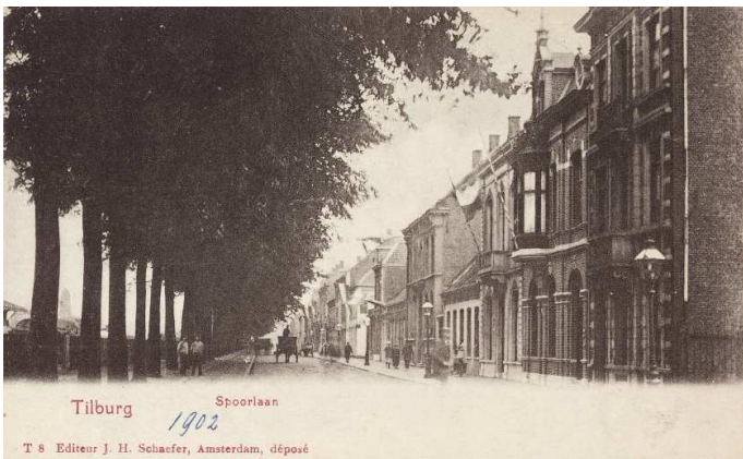
Afbeelding 3: de Spoorlaan in 1902. Het tweede huis rechts is het toen net gebouwde woonhuis van de familie Lenglet met huisnummer 82 (nu 380).

liep. De aanbesteding vindt plaats bij architect André Blomjous in juli 1898 3 . Ervan uitgaande dat de bouw één à twee jaar in beslag heeft genomen, zijn de gebouwen in de loop van het jaar 1900 gerealiseerd. Zie ook afbeelding 3 van de Spoorlaan in 1902.