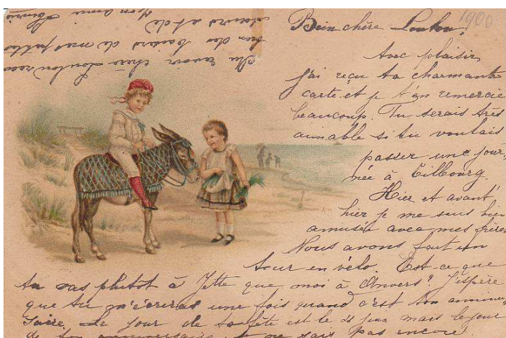
Afbeelding 4: Briefkaart met de perfin J.L., verstuurd door Henriëtte Lenglet.