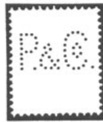
Compleet afb. cat.