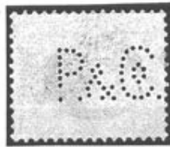
Mist P2 en &12