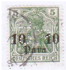
Perfin CL/J van Crédit Lyonnais in Jeruzalem

Een aanvulling op de verschillende Levant perfins die voorkomen in zegels van de Duitse postkantoren in de Levant is de melding van de perfin CLJ-23 in een Duitse Levantzegel van de uitgifte van 1906.