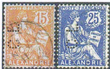
Perfins CL van Crédit Lyonnais in Alexandrië.

Een geheel nieuwe Levantperfin is de perfin CL-16 in Levantzegels van de Franse kantoren in Alexandrië (Egypte). Deze perfin is in de gewone Egyptische zegels nog onbekend.