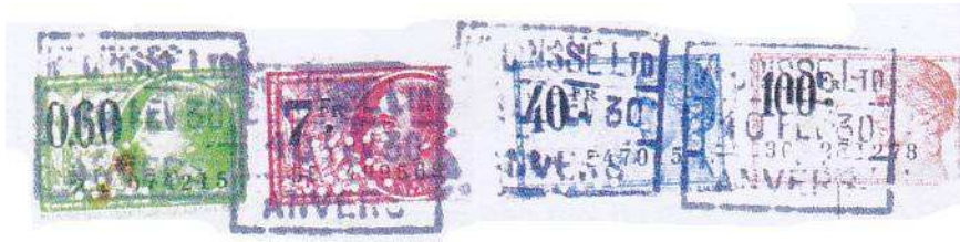
Afb. De vier geperforeerde fiscaalzegels. (ware grootte).

Ik zocht tevergeefs naar deze perfin in de catalogus en andere documentatie. Ik bekeek ook alle perfins, die beginnen of eindigen met een "M", maar vond niets dat overeenkomt.